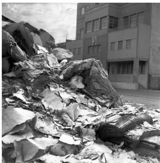
Heinrich Annemarie, Sin título , La Boca, ca. 1955. Archivo IIAC UNTREF -