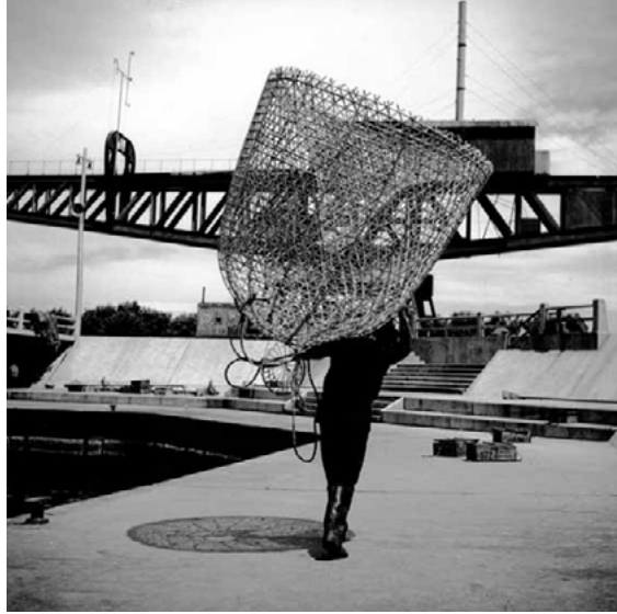
Heinrich Annemarie, El Pescador , 1950. Archivo IIAC UNTREF - Fondo Annemarie Heinrich.