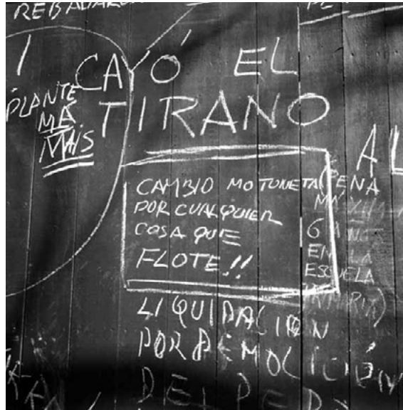
Heinrich Annemarie, Grafiti.

El trabajo con el fondo Heinrich también consistió en tareas de investigación histórico-cultural y técnica de las piezas a fin de reponer su contexto de producción y sus condiciones históricas de circulación y consumo, de modo que permitiera la organización para la consulta de los investigadores, la relocación de las piezas en un adecuado sistema de guarda en sobres y cajas libres de ácido con el