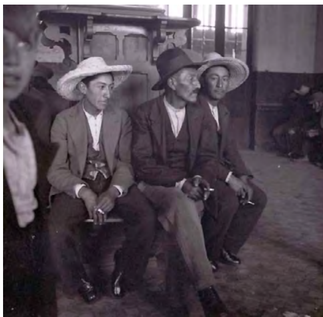
Heinrich Annemarie, La Espera Chile , sf.

Por esa época, Heinrich realizó una serie de viajes en los cuales tomaba fotografías que le permitieron explorar –más allá de un destino comercial– las posibilidades de su cámara fuera del estudio. En ellas capturaba paisajes, objetos, retratos, reflejos y temas que despertaban su atención.