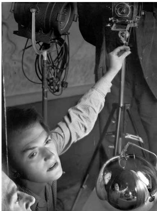
Heinrich Annemarie, Serie Autoretratos con cámara y esfera espejada ca. 1945.