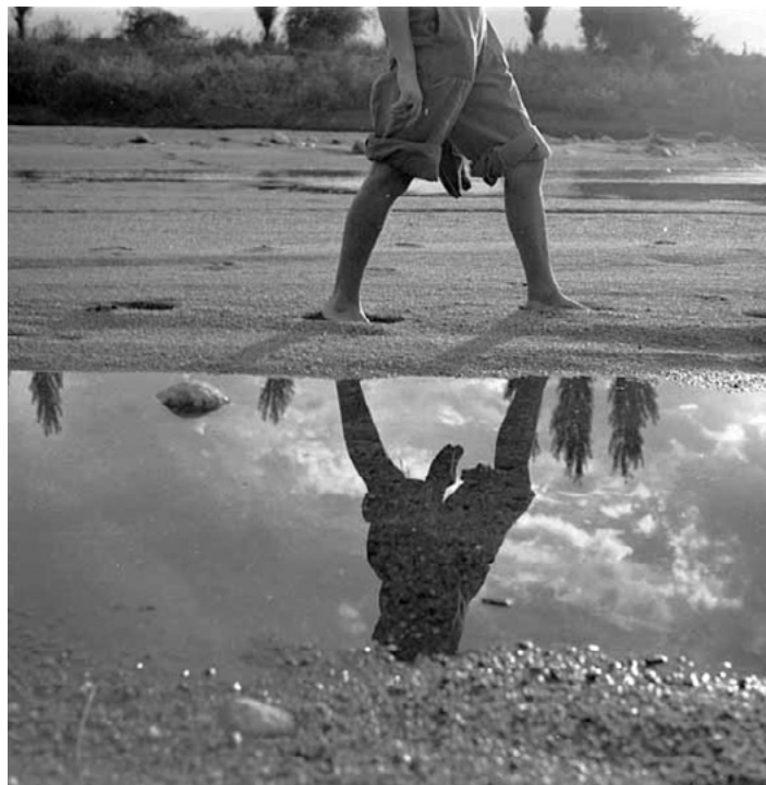
Heinrich Annemarie, Serie Reflejos sf.

El proyecto contó con el trabajo de investigadores formados y pasantes, seleccionados entre el estudiantado de la Licenciatura en Gestión del Arte y la Cultura, la licenciatura en Artes Electrónicas y la Maestría en Curaduría en Artes Visuales de la UNTREF. Los investigadores tenían a su cargo tareas de catalogación y digitalización del material en el marco de la organización de un catálogo digital. Los pasantes colaboraron con la digitalización y edición de la mayor parte del material bajo la coordinación de investigadores formados.