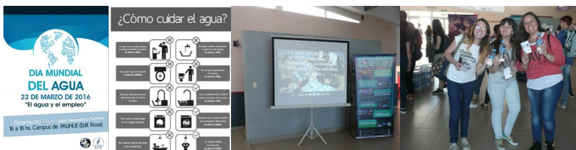
Figura 1. Día Mundial del Agua en la UNS.

Una actividad similar se organizó con la misma empresa para el 22 de abril, Día de la Tierra Madre, en esta oportunidad el lema de la ONU fue «Árboles para la Tierra», por ello se donaron árboles para el campus. El acto será el inicio de un proceso de forestación que por la cantidad (150) y variedad de especies involucradas (acacias tuscas, acacias viscos, jacarandaes, manzanos de flor, almendros, lapachos y fresnos), durará aproximadamente dos años (Figura 2).