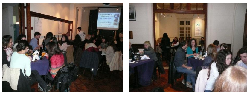
Figura 3. Conferencia: Mares y océanos ¿Depósitos infinitos?

Otro caso se da cada 8 de junio con la celebración del día de los Océanos. Este año, se ofreció una conferencia abierta a la comunidad en la Casa Coleman perteneciente a CONICET y FUNDASUR (Fundación de la UNS). La misma estuvo a cargo de una docente de la carrera de Licenciatura en Oceanografía que versó sobre la contaminación de mares y océanos. Previo a esto se compartió un vernissage temático (Figura 3).