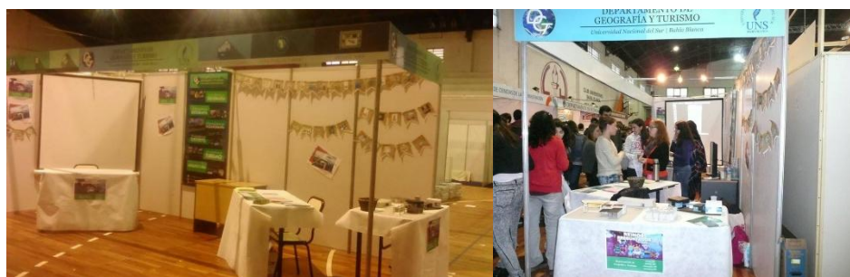
Figura 4. Stand del Depto de Geografía y Turismo. Muestra Informativa de Carreras del Nivel Superior 2016.

Es así que, año a año, se van incorporando y adecuando nuevas actividades dentro de la propuesta que realiza la Secretaria de Extensión a la Muestra de Carreras.