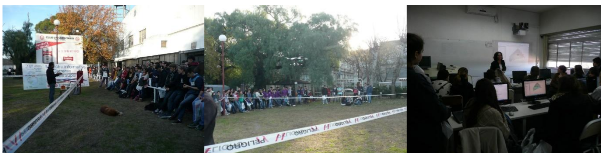
Figura 5. Actividades del Depto. de Geografía y Turismo en la Muestra Informativa de Carreras del Nivel Superior. 2015 y 2016.