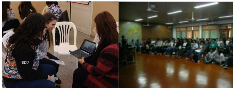
Figura 8. Programa de visitas a escuelas secundarias: la oferta académica de grado del DGyT Edición 2015/16.

Durante todo el año se ofrecen charlas a escuelas dentro del «Programa de visitas a escuelas secundarias: la oferta académica de grado del DGyT». En esta actividad se invita a alumnos de las diferentes carreras que son el nexo entre el disertante y el alumno de escuela media y participan contando sus experiencias, repartiendo folletería o respondiendo a las inquietudes de los alumnos (Figura 8).