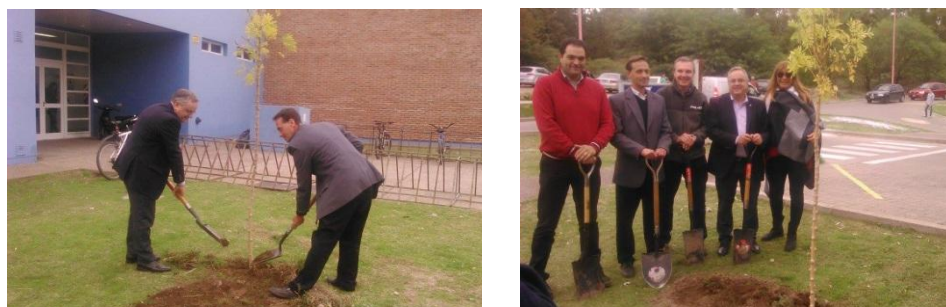
Figura 2. Actividades por el Día de la Madre Tierra en la UNS.