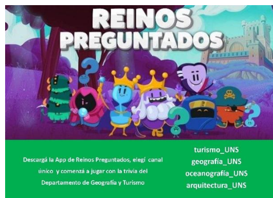
Figura 7. Reinos Preguntados

Durante todo el año se ofrecen charlas a escuelas dentro del «Programa de visitas a escuelas secundarias: la oferta académica de grado del DGyT». En esta actividad se invita a alumnos de las diferentes carreras que son el nexo entre el disertante y el alumno de escuela media y participan contando sus experiencias, repartiendo folletería o respondiendo a las inquietudes de los alumnos (Figura 8).