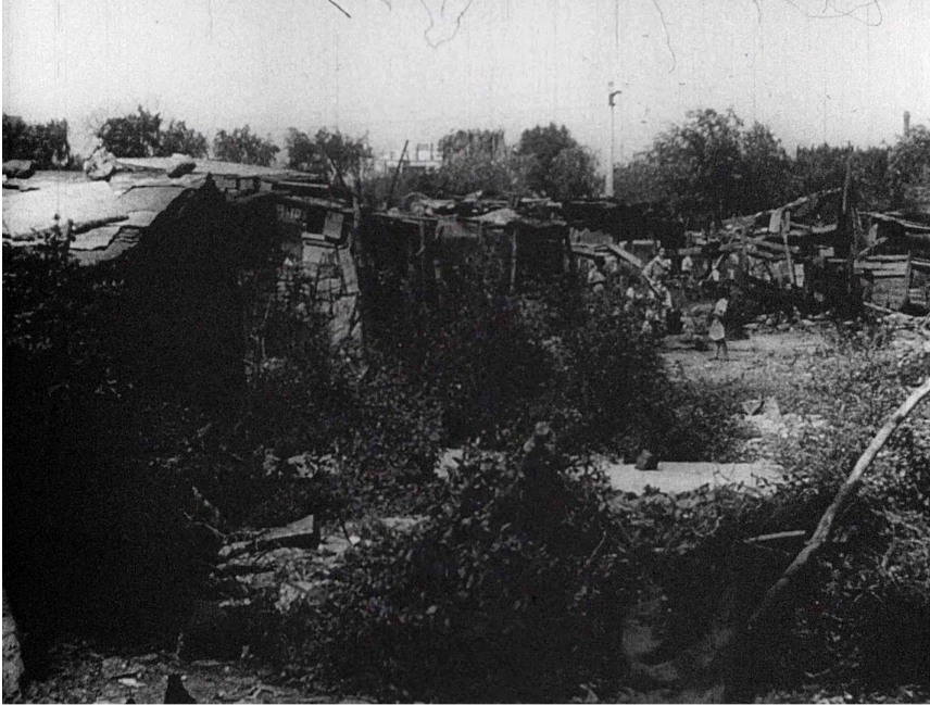
FIGURA 2 | Capturas de pantalla del corto publicitario "Nuevos destinos en la nueva Argentina", que ilustran la narrativa del peronismo respecto a las villas