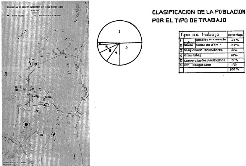
FIGURA 4 | La cuantificación de las villas

de la ecuación modernizadora, concebida en relación con una temporalidad anterior o estática, había preparado el terreno para una imagen de las villas como paradigma espacial del atraso. Estas miradas denigrantes contradecían los estudios presentados por el plan mismo, incluyendo (entre otros) el censo que reflejaba un 99% de empleo (Figura 4) o los elogios al trabajo de comisiones vecinales como la de Villa Jardín. Quedaba en evidencia así que el concepto de “villa” propuesto era reflejo, más que de la villa en sí, de una agenda política y de la ansiedad por ponerla en práctica.