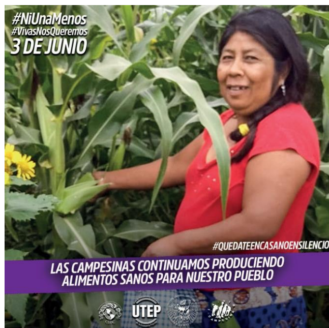
Imagen 3. Adhesión del MNCI a la campaña #NiUnaMenos

Nota: imagen elaborada para la campaña de las mujeres campesino-indígenas en el marco de la manifestación #NiUnaMenos, el 3 de junio de 2020.