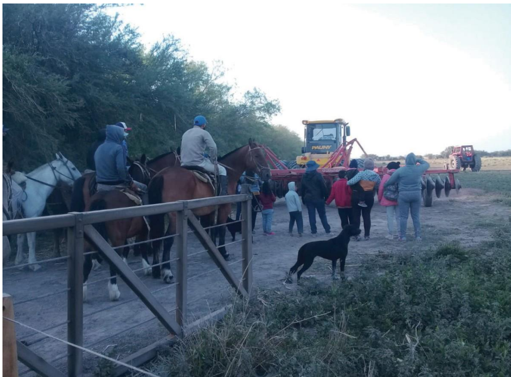
Imagen 1. Movilización en la comunidad La Fernina

Nota: la imagen captura una instancia de organización comunitaria del 6 de noviembre de 2020, en la cual las mujeres y niños/as se ubican en primera fila, a modo de estrategia defensiva, para prevenir posibles enfrentamientos violentos. Se trata en este caso de la comunidad campesina La Fernina, perteneciente al departamento de Añatuya, Santiago del Estero. Según la información provista a la investigadora por parte de miembros de MoCaSE, varios de sus animales habían sido robados y asesinados a modo de amedrentamiento por parte del empresario interesado en dichas tierras. El movimiento de campesinos/as logró posteriormente acordar una indemnización monetaria.