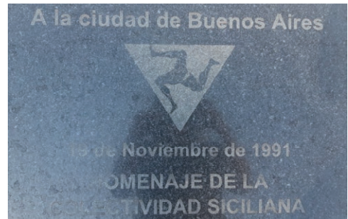
Imágenes 19 y 20. Placas recordatorias, Plaza Sicilia, Palermo, 2021.