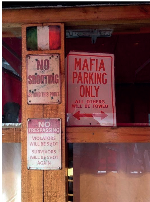
Imagen 16. Cartel en el frente del restaurant La Locanda , Recoleta, 2019.

John Gotti el capo mafioso más grande de los últimos tiempos, muere en 2002, en Springfield, Wisconsin, USA, de cáncer de pulmón. Por favor, no lo imite... en eso. A partir del 1° de Octubre de 2006 prohibido fumar en lugares públicos ley n° 1799.