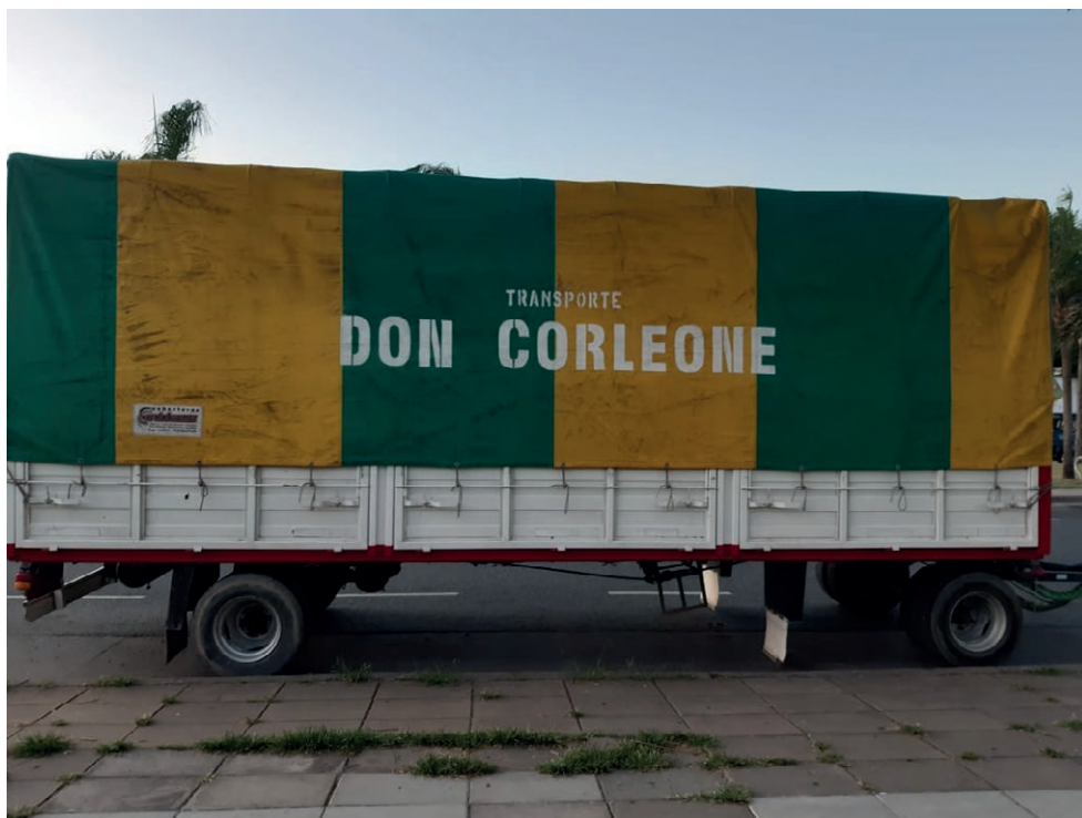
Imagen 4. Transporte Don Corleone , Saavedra, 2021.

taría funcional a su reducción a una mera imagen, sin connotaciones políticas aparentes. A diferencia del presente mundano y rutinario, el pasado parece estar lleno de acontecimientos, medibles a partir del estatus heroico de sus personajes, la relevancia de los temas a tratar, su intensidad dramática, etc. (Buonanno, 2012). Pero en esta vuelta al pasado podría estar operando asimismo cierta negación del fenómeno en la sociedad argentina contemporánea.