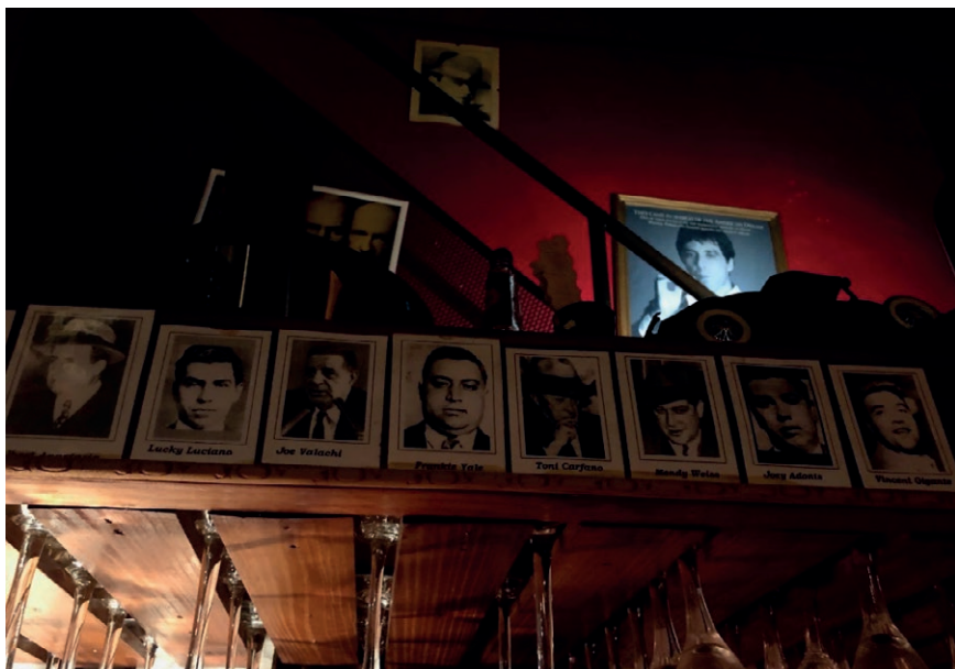
Imagen 13. Barra, restaurant Arte de mafia , Palermo, 2021.