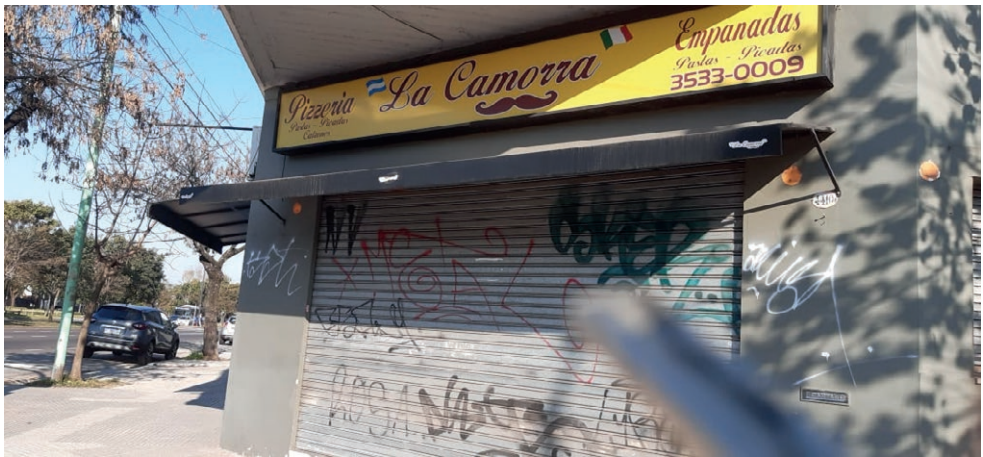
Imagen 15. Marquesina, pizzería La Camorra , Saavedra, 2019.