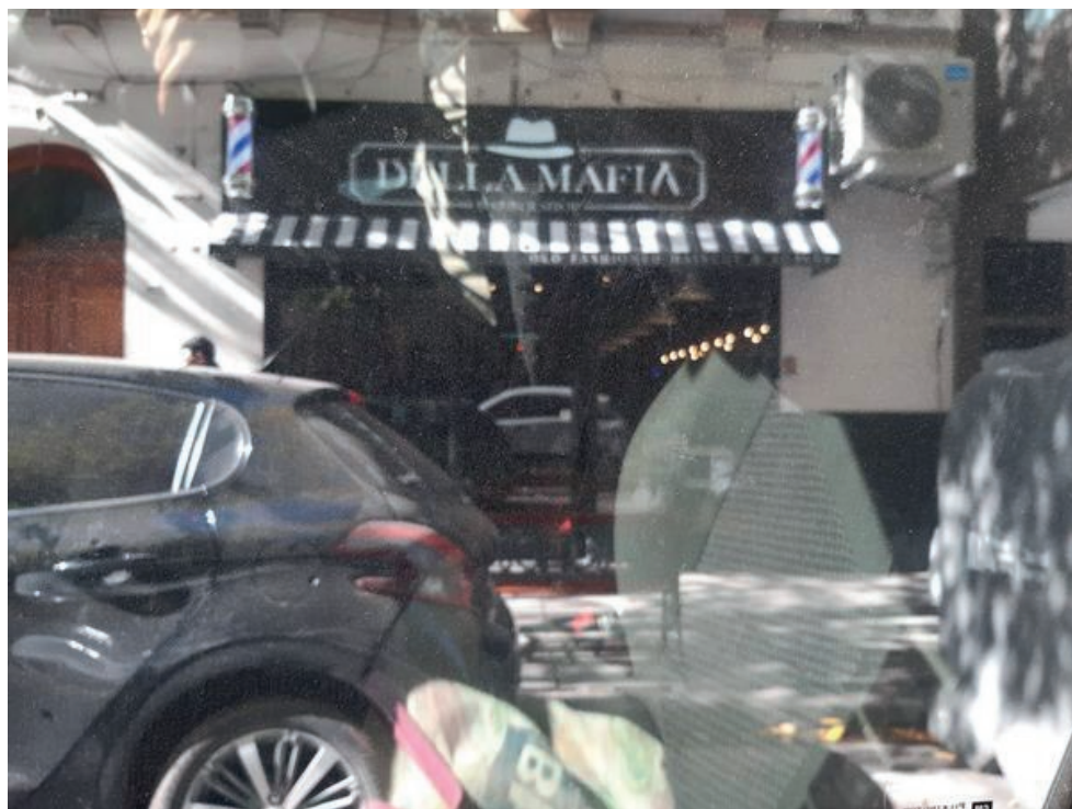
Imagen 3. Peluquería Della Mafia , Recoleta, 2021.