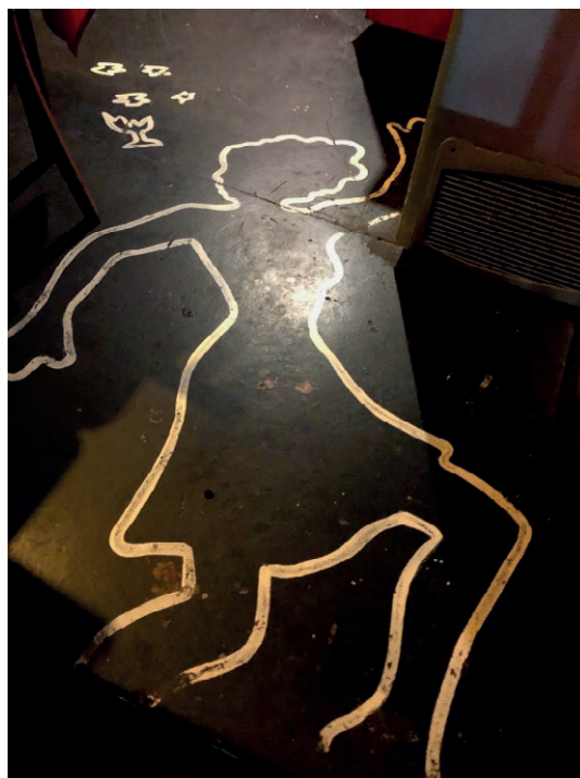
Imagen 14. Contorno de figura femenina dibujada en el piso, restaurant Arte de mafia , Palermo, 2021.

En esta economía visual, las mujeres permanecen generalmente ocultas o bien resultan identificables a través de sus curvas en calidad de víctimas anónimas de asesinatos.