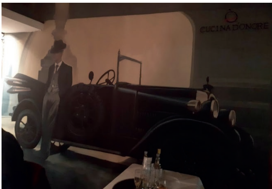
Imagen 6. Mural, Cucina d'onore , Puerto Madero, 2021.