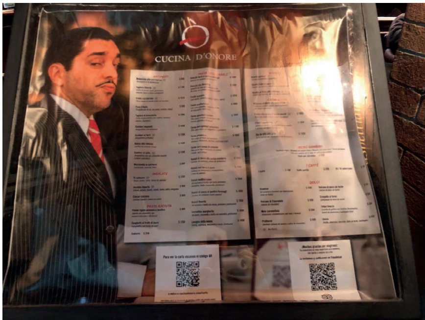
Imagen 12. Carta, restaurant Cucina d'onore , Puerto Madero, 2021.