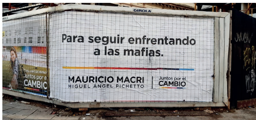
Imagen 17. Afiche de campaña, Juntos por el Cambio , Belgrano, 2019.

Dado que desde una perspectiva discursiva el silencio resulta tan importante –o más– que lo estructurado (Arfuch, 1987), es oportuno señalar la ausencia de topónimos– nombres de calles, parque y/o instituciones públicas– que hagan visible la lucha de quienes combaten las mafias en los espacios analizados. Por ejemplo, llama la atención que en la plaza Sicilia, ubicada en el barrio porteño de Palermo, entre otras intervenciones artísticas y culturales que exaltan las figuras de Sarmiento, Tejedor, Gandhi, Confucio y hasta de Caperucita Roja, la única referencia siciliana sea a Luigi Pirandello 6 . Esta elección da cuenta de una imagen de Sicilia proyectada en la Argentina sin tensiones, que niega los rasgos menos positivos de su cultura a favor de otros acaso mejor aceptados, tanto en origen como en destino. Junto al busto de Pirandello, dos placas que datan de 1991, año que coincide con la visita a Buenos Aires de otro célebre siciliano cuyo paso por la ciudad no parece haber dejado rastros duraderos: el juez Giovanni Falcone (Balsas, 2022).