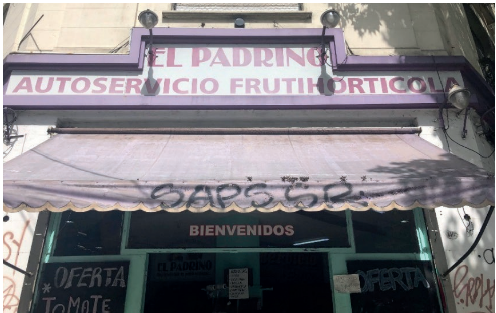
Imagen 7. Marquesina de Autoservicio El Padrino , Almagro, 2021.

Entre los tópicos aludidos en los paisajes lingüísticos que tematizan las mafias en la Capital de la Argentina, se destacan el gangsterismo, el honor, la omertà , la familia y la estructura interna de las organizaciones mafiosas, incluso en clave paródica. La frecuente asociación con el chiste y otras formas que apelan visiblemente al humor invocada por los paisajes lingüísticos sobre mafias italianas en la Ciudad de Buenos Aires podría ser interpretada en términos de cierta negación al servicio de evitar que algo que no se quiere ver aflore. Tal es el caso de la Heladería Arkyn , caracterizada por una ambientación muy próxima a la estética del dibujo animado, en el barrio de Palermo. Como en los casos antes analizados, la relación con la mafia parece quedar establecida por el helado como producto típico de la gastronomía italiana.