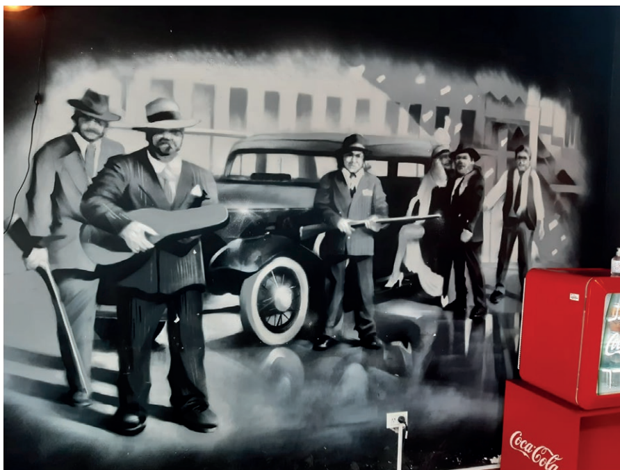
Imagen 5. Mural, Gambino , Belgrano, 2021.