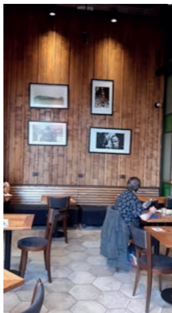
Imágenes 8 y 9. Escenas de la película El padrino , Parque Saavedra y Villa Crespo, 2021.