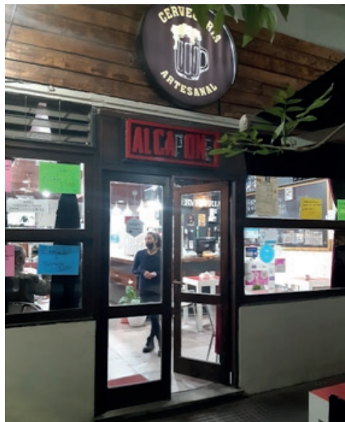
Imágenes 1 y 2. Restaurant Cucina d’Onore , Puerto Madero, y cervecería Al Capone , Parque Patricios, 2021.