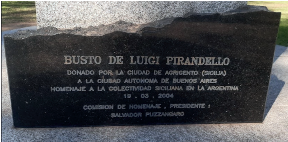
Imagen 18. Busto de Luigi Pirandello, Plaza Sicilia, Palermo, 2021.