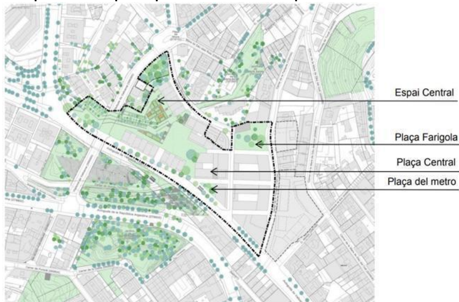
Mapa 5. Nuevas plazas públicas en Vallcarca a partir de la MMPGM 2018