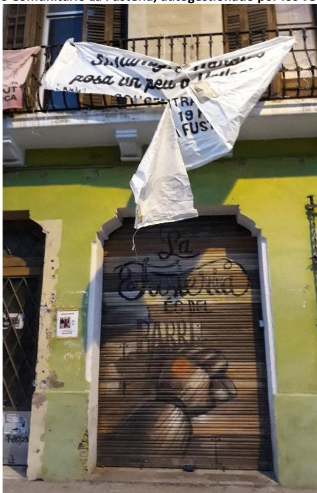
Figura 12. Espacio Comunitario La Fustería, autogestionado por los vecinos de Vallcarca