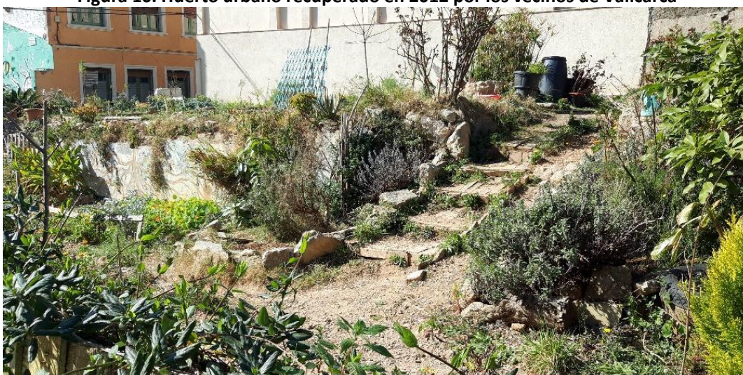
Figura 10. Huerto urbano recuperado en 2012 por los vecinos de Vallcarca