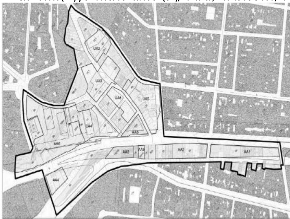
Mapa 4. Áreas Aisladas (AA) y Unidades de Actuación (UA), Vallcarca, Distrito de Gracia, Barcelona