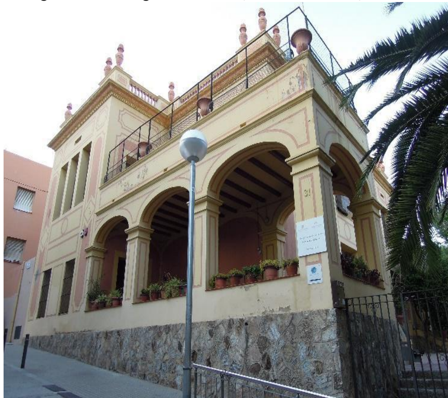
Figura 1. Casa antigua de Vallcarca, Distrito de Gracia, Barcelona