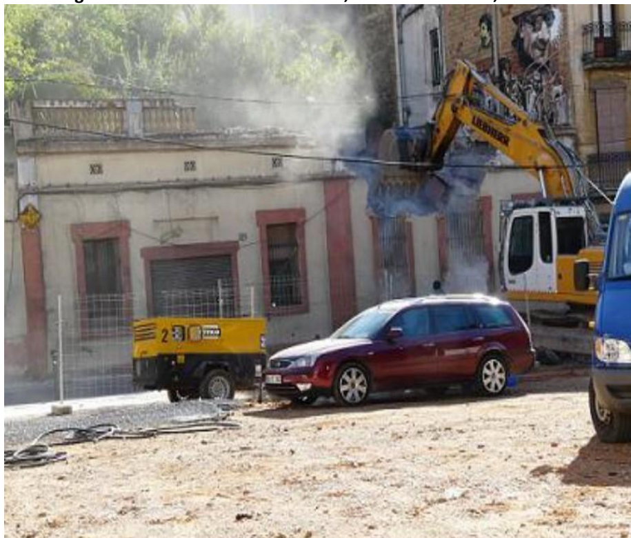
Figura 6. Demoliciones en Vallcarca, Distrito de Gracia, Barcelona