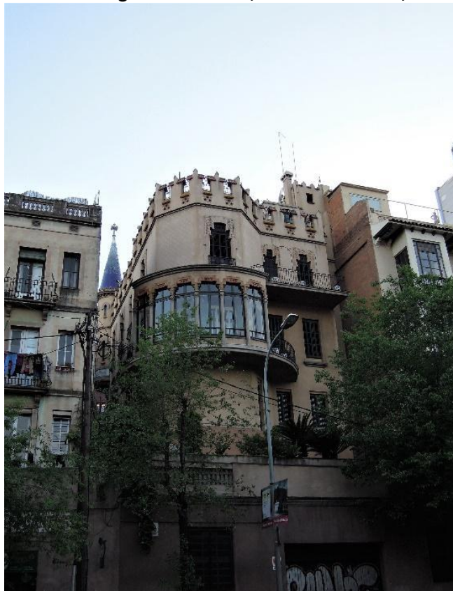
Figura 2. Casa antigua de Vallcarca, Distrito de Gracia, Barcelona