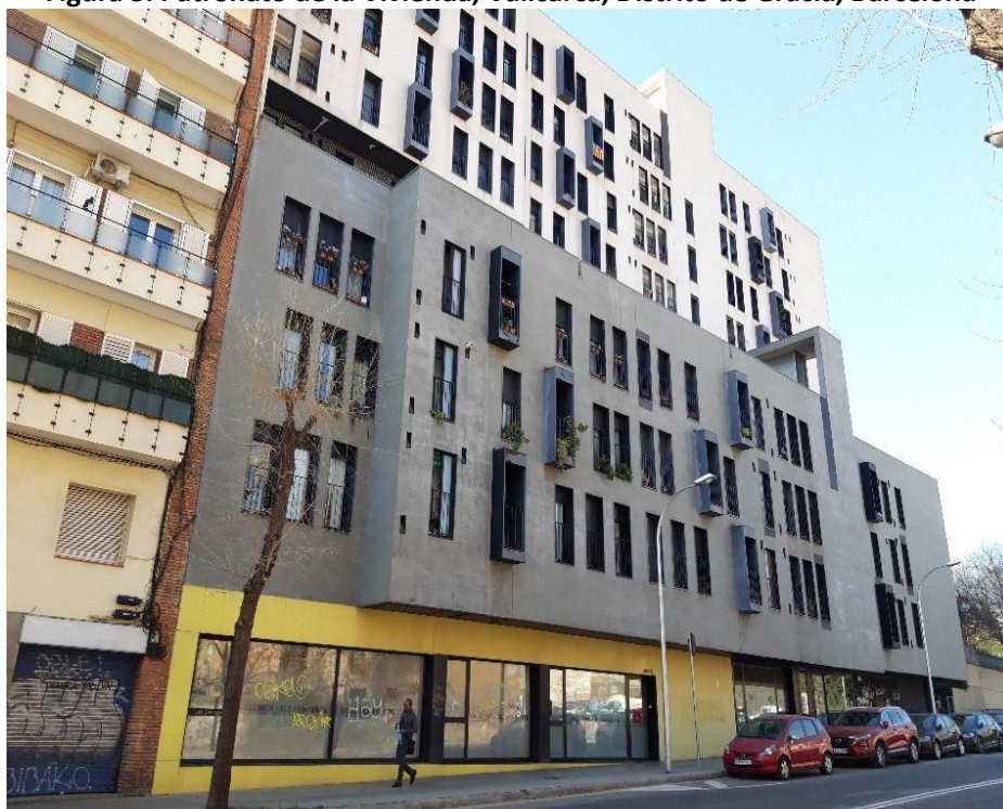
Figura 5. Patronato de la Vivienda, Vallcarca, Distrito de Gracia, Barcelona