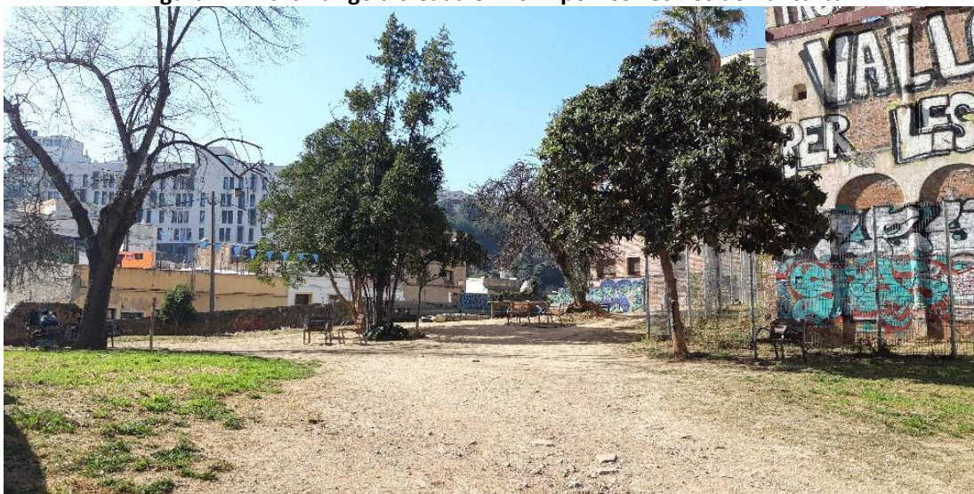
Figura 11. Plaza Farigola creada en 2012 por los vecinos de Vallcarca