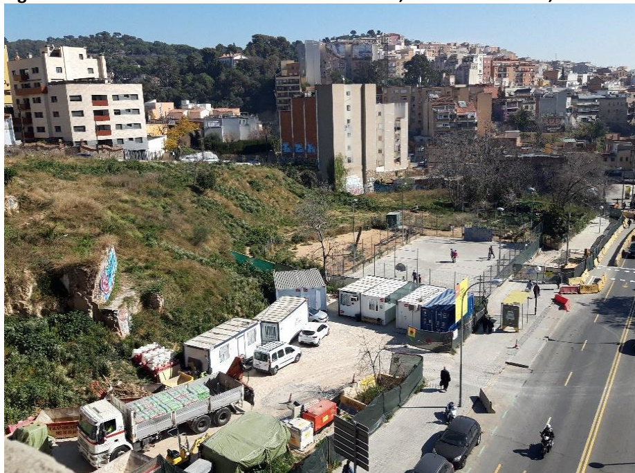
Figura 7. Demoliciones en las colinas de Vallcarca, Distrito de Gracia, Barcelona 6