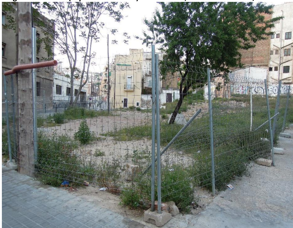
Figura 9. Solares (espacios vacantes) de Vallcarca, Distrito de Gracia, Barcelona