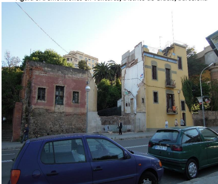
Figura 8. Demoliciones en Vallcarca, Distrito de Gracia, Barcelona