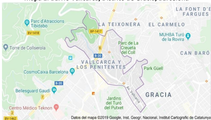
Mapa 1. Barrio Vallcarca, Distrito de Gracia, Barcelona

comenzaron a aparecer talleres mecánicos, carpinterías, locales de materiales para la construcción, fábricas de pintura, carbonerías, peluquerías, bares, salas de baile, entre otros comercios que remiten a una cultura popular.