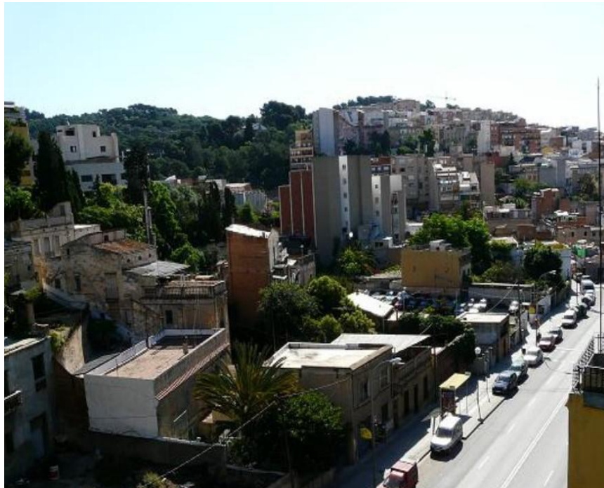
Figura 3. Construcciones sobre las colinas del barrio Vallcarca, Distrito de Gracia, Barcelona