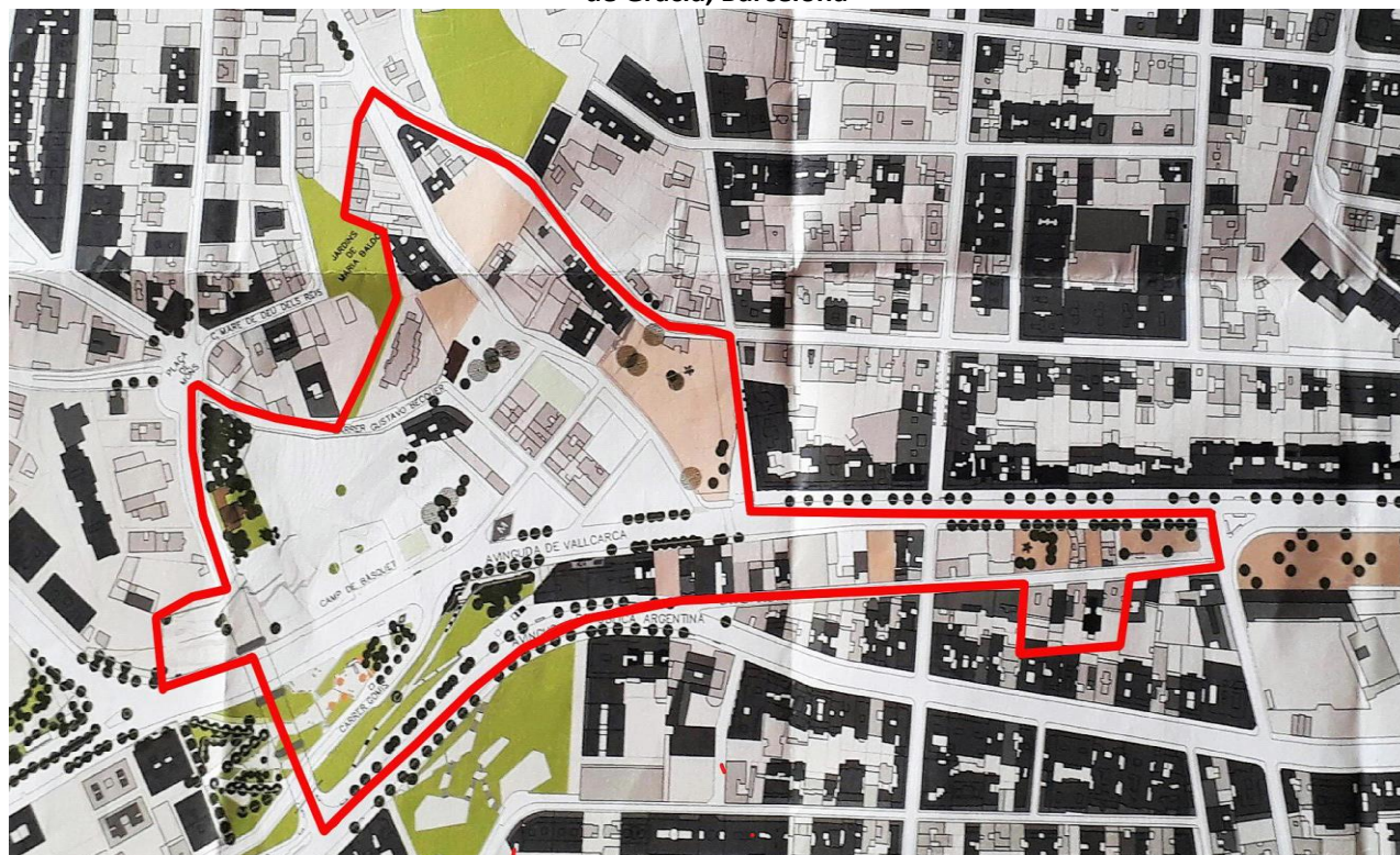
Mapa 3. Zonas afectadas por el PGM de 1976 y zonas demolidas entre 2004 y 2014, Vallcarca, Distrito de Gracia, Barcelona