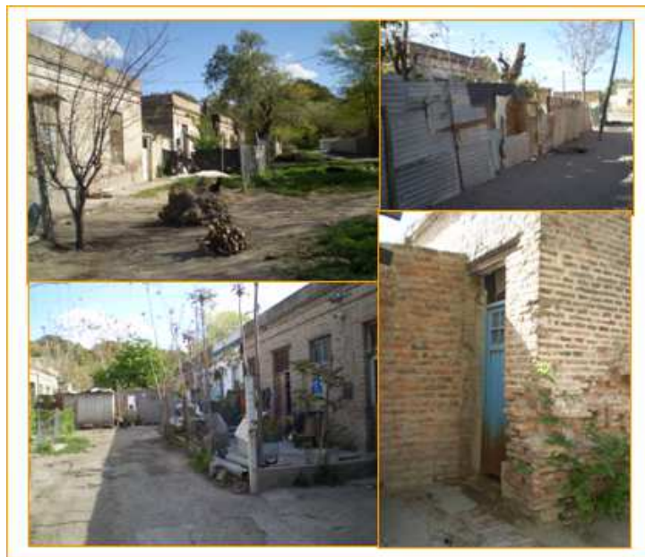
Figura 3. La falta de mantenimiento en la Colonia Sansinena se evidencia en el deterioro de las edificaciones