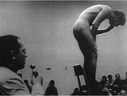
Otto Muehl, 13 short films , 1967-1970.

Artista austríaco, co-fundador del accionismo vienés. Nació el 16 de junio de 1925 en Grodnau, Mariasdorf, Burgenland, Austria. En 1972 fundó la Comuna Friedrichshof, que existió durante varios años antes de desmoronarse en la década de 1990.