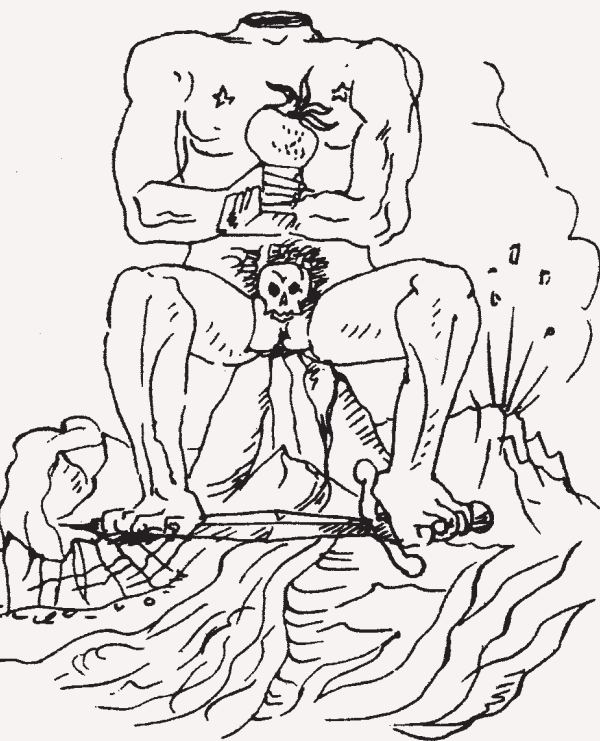
La espada es la pasarela

Revista (1936-1939) y secta esotérica creada por George Bataille. Entre los miembros de esta comunidad artística, filosófica, política se encontraban, además de su fundador, Pierre Klossowski, André Masson, Jean Rollin,