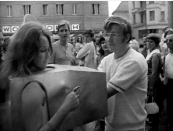
VALIE EXPORT, Touch Cinema , 1968.

A uno que le dijo en un convite: “¡Canta!”, le contestó: “Y tú tócame la flauta”.