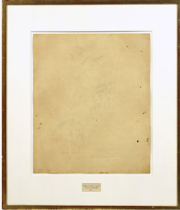
Robert Rauschenberg, Erased de Kooning Drawing , 1953.

Echó al fuego las lecciones de su maestro Teofastro citando el siguiente verso: "Acude acá Hefesto, Tétis ahora te necesita".