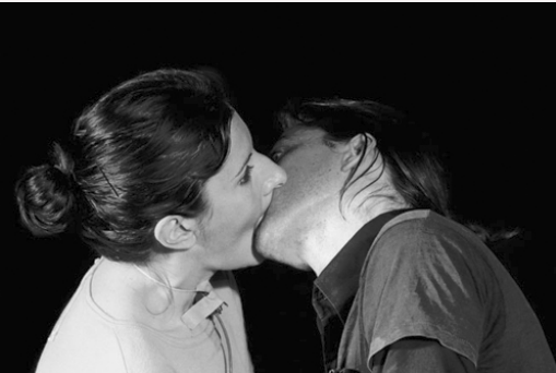
Marina Abramović y Ulay, Death Self , 1976.

La última performance en vida fue la contención de la respiración, hecho que llevó a la muerte, según afirman algunos documentos.