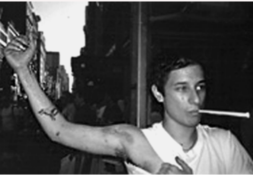
Harmony Korine, Fight Harm , Nueva York, 1999.

Al implorar algo a un director de un gimnasio, le agarraba de las caderas. Y como éste se irritara, le dijo: “¿Pues qué, no son estas tan tuyas como las rodillas?”. El gesto habitual de la súplica es echarse ante uno y agarrarle de las rodillas, como hace, por ejemplo, Tetis antes Zeus en el Canto I de la Iliada.