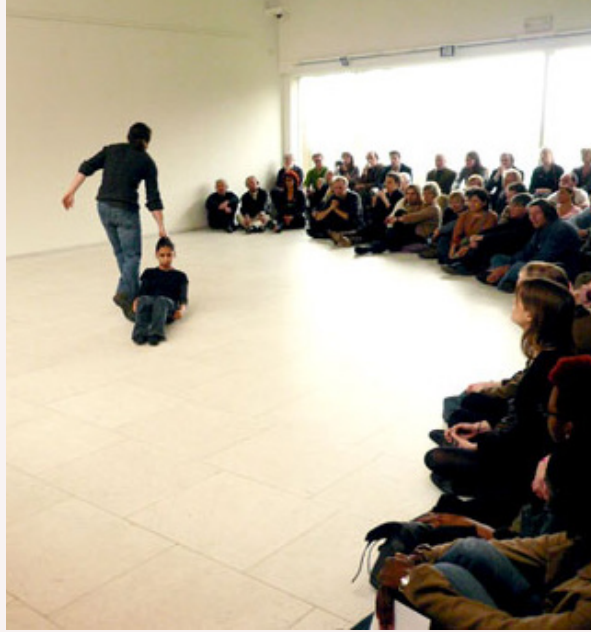
Regina Galindo, Trayectoria , Museum voor Moderne Kunst Arnhem, Países Bajos, 2008.

Crates, según Diocles, fue arrastrado por Menedemo de Eretria. El caso es que este era de hermoso aspecto y se creía que tenía relaciones íntimas con Asclepiades de Fliunte. Con que Crates le palmeó las caderas y dijo: “¿Anduvo por aquí Asclepiades?”. Por esto se enfureció Menedemo y lo arrastró, cuando él pronunció aquella frase de la Iliada: “Lo arrastraba agarrándolo de un pie por el celeste atrio”.