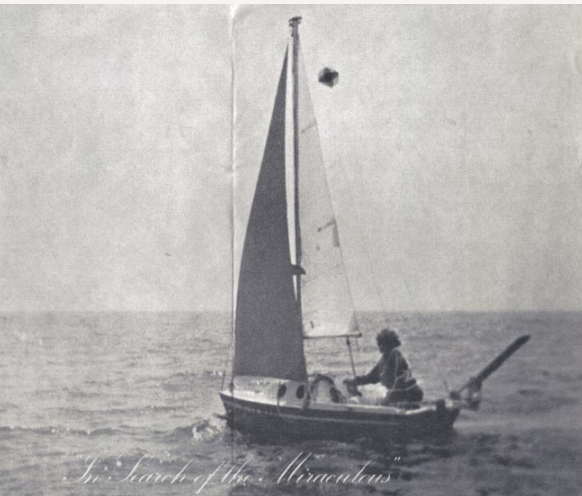
Bas Jan Ader, In search of the Miraculous , 1975.

Diógenes redactó en un testamento su deseo de que después de muerto su cuerpo fuera abandonado a las aves de presa y a los perros.