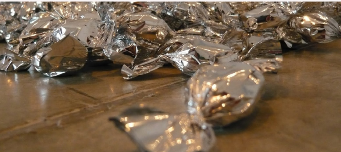
Félix González Torres, Sin título, Para un hombre en uniforme , 1991.

Mientras comía higos secos se encontró inesperadamente con Platón y lo invitó a participar. Cuando éste tomó algunos y se los comía, exclamó: “¡Participar dije, no zampártelos!” [Acción en alusión a la teoría platónica de que las cosas “participan” de las ideas.]