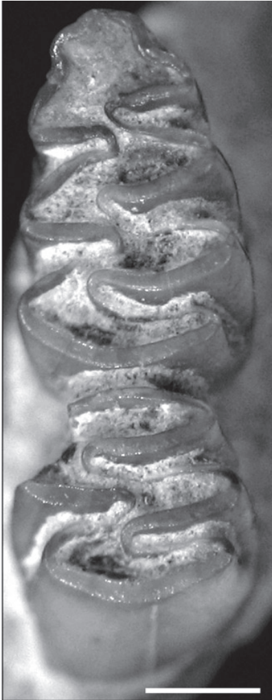
Figura 2 - Vista oclusal de la serie molar m1-m2 (longitud 5.1 mm) inferior izquierda de Reithrodon auritus MAMM-PV 049 (Barrancas de Milanesi, 1.5 km al suroeste de la localidad de Miramar, Provincia de Córdoba, Argentina. Lujanense). Escala: 1 mm.

De acuerdo a Ringuelet (1961) la fauna perteneciente al dominio Pampásico puede ser caracterizada como un gigantesco ecotono entre los dominios zoogeográficos Subtropical y Central o Subandino (ver Figura 1). En este sentido, las evidencias dis-