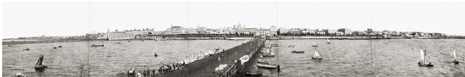
IMAGEN 8 Vista de Buenos Aires desde el río , ca.1883. Fotografía panorámica de Samuel Boote realizada a partir de cinco tomas sucesivas de 20 x 133 cm. Colección Daniel Sale.

Otro de los temas predilectos de este tipo de espectáculos fueron los sucesos de actualidad. Desde coronaciones reales hasta naufragios o expediciones polares, los panoramas pictóricos proveían una información visual y realista todavía infrecuente a través de otros medios, y presentaban una espectacularización de la realidad que se iría acrecentando a través de las décadas subsiguientes hasta alcanzar su punto cúlmine con la llegada del cine. La fotografía panorámica también se apropió y explotó este eje temático presentando tópicos y sucesos que en muchos casos serían simultáneamente recuperados en los primeros registros fílmicos. Así por ejemplo, en una postal panorámica tomada por Eugenio Avanzi en 1900, se registra el encuentro de las Escuadras Argentina y Brasileña en los diques del puerto de Buenos Aires con motivo de la visita del presidente de Brasil, Manuel Ferraz de Campos Salles, un evento que fue también motivo de una de las más antiguas vistas cinematográficas realizadas en el país.