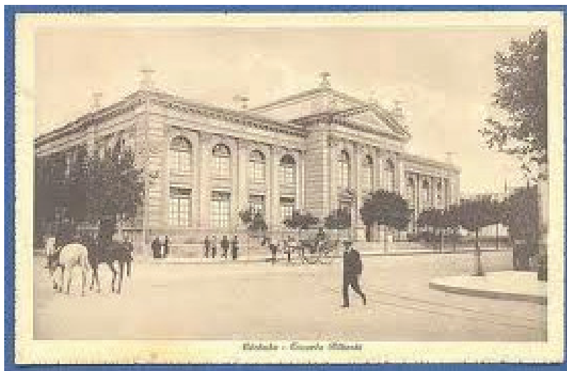
Foto 2. Escuela Alberdi

Pero su labor sufrió otro traspie al ser separada de sus cargos, lo que la decide trasladarse a la Capital Federal. Tiempo después recordó esa instancia de la siguiente manera: “La lucha ha sido ardua, el camino difícil. A cada paso un obstáculo que debía sortear sin dejar aquel sagrado deber de fe, de esperanzas, de consagración, de dignidad para poder llevar con honor el nombre de riojana” 16 .