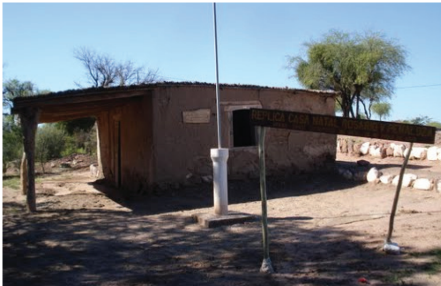
Casa natal de Rosário Vera Peñaloza.