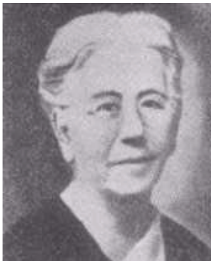
Rosario Vera Peñaloza (1873-1950)

Para fines del siglo XIX habían egresado de él más de una decena de profesoras las que, en su mayoría, regresaron a sus provincias de origen para instalar los primeros jardines de infantes 14 . Una de ellas fue Rosario quien en 1898 regresó a La Rioja, donde en 1900 fundó el jardín de Infantes anexo a la Escuela Normal, primero de la provincia y que hoy lleva su nombre. Además se desempeñó como profesora de castellano y trabajo manual en virtud que además