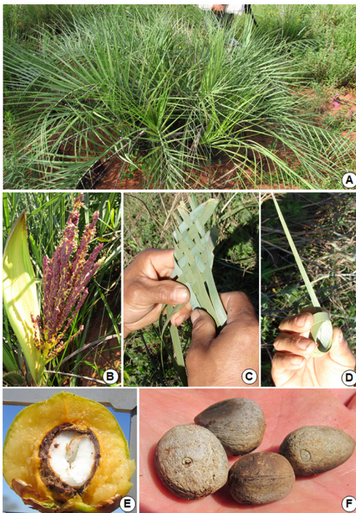
Figura 4. Butia spp. A y B: Panta e inflorescencia de Butia pini . C y D: juguetes trenzados con segmentos foliares. E y F: frutos y semillas de Butia pini .

Entre los Ava Chiripá de Misiones se menciona el antiguo uso de las hojas de Butia spp. para trenzar sandalias usadas