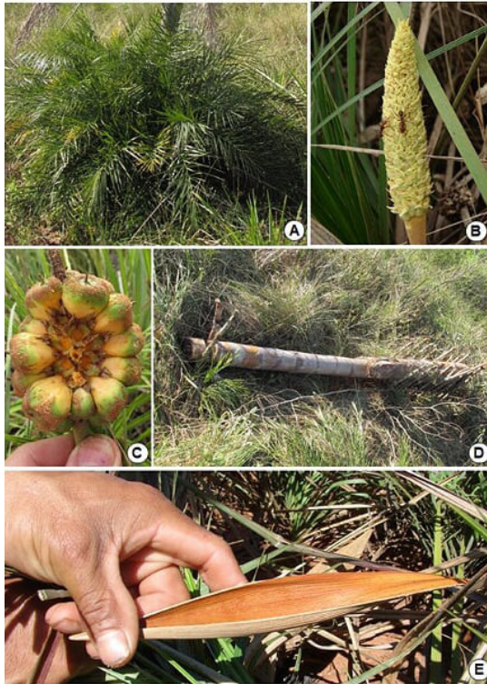
Figura 3. Allagoptera campestris . A: plantas. B: inflorescencia. C: frutos en proceso de maduración. D: trampa instalada junto a población de la especie. E: espata.

a las especies enanas del género Butia . En la localidad de Loreto (Candelaria) hay poblaciones establecidas también sobre suelos arcillosos lateríticos, pero en áreas muy modificadas por la introducción de monocultivos forestales.