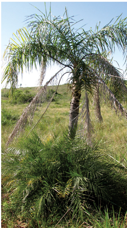
Palmeras acaules y arborescentes en el Distrito de los Campos (Misiones, Argentina).