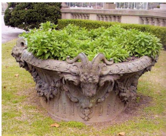
Varios Machos Cabríos en un bebedero para caballos en el Hipódromo Argentino, usado como ornamento y proveniente también de la fábrica de Val D’Osne.