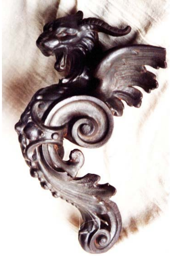
El objeto de hierro después de su restauración.