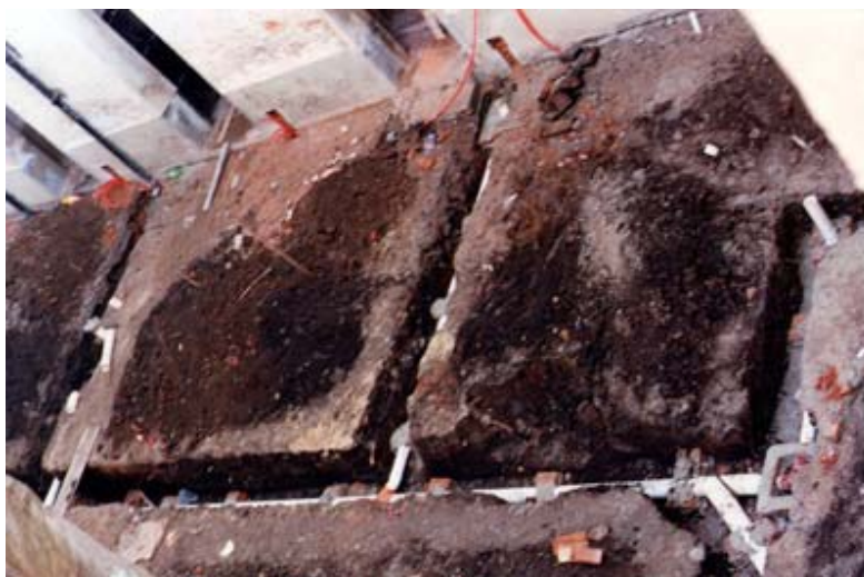
El lugar del hallazgo en el cruce central de cañerías del claustro, nótese el grado de destrucción de un claustro del siglo XVIII.

El trabajo de supervisión de la excavación de zanjas en diferentes zonas del conjunto sólo fue, por lo dicho, una operación de rescate de lo que se iba hallando a medida que se excavaban cerca de 250 metros lineales. Estas a veces iban a profundidad (llegaron a los dos metros) y se hacía con maquinaria. Por otra parte era tanto lo encontrado, por la riqueza del edificio y su historia, que si bien dio información significativa debe haber sido mucho lo perdido. Se hicieron zanjas en el exterior y el interior del convento, se excavó dentro de celdas y se cambiaron pisos por doquier. Intentaremos restringirnos a la operación de salvataje en las zanjas hechas en el claustro.