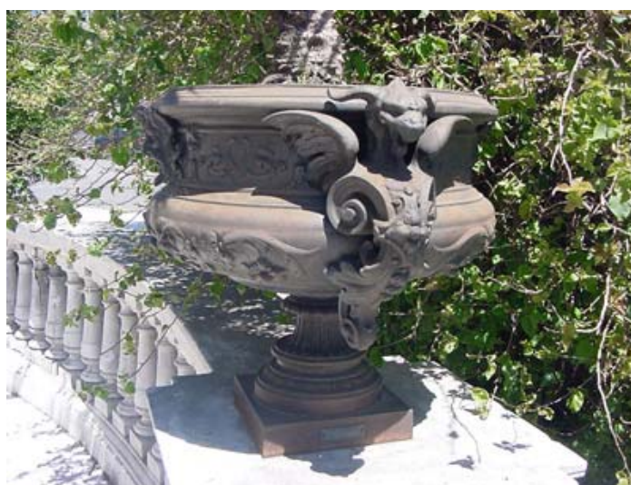
Macetero de gran tamaño que ornamenta la entrada de la Casa de Gobierno, fabricado en Francia a finales del siglo XIX, idéntico al hallado

Este tipo de ornamento en hierro o bronce, fue muy usado como decoración, sin simbolismo alguno, y por su fuerza expresiva sirvió en el siglo XIX hasta para jarrones y maceteros, como en este caso que queremos demostrar. Por su forma debió pertenecer a una manija de un copón – a veces erróneamente llamados vasos-, que alcanzan el metro de altura y que llegaban en los barcos desde Francia. La mayor parte de los existentes en la ciudad vinieron de la fábrica Val D’Osne en donde se los hacía desde la década de 1830. Para la mitad de ese siglo y aprovechando la enorme difusión mundial que tuvieron las grandes exposiciones del Crystal Palace y las de París a partir de 1851, la fábrica tuvo una estrategia de ventas muy activa, vendiendo en especial esculturas y fuentes. Sus formas peculiares y sus dimensiones colosales hacían juego con los grandes edificios que los estados nacionales estaban erigiendo por todo el mundo, a diferencia de los estilos de las realezas que los precedieron. Buenos Aires no fue una excepción y aun hay docenas de estas obras dispersas por todo el país.