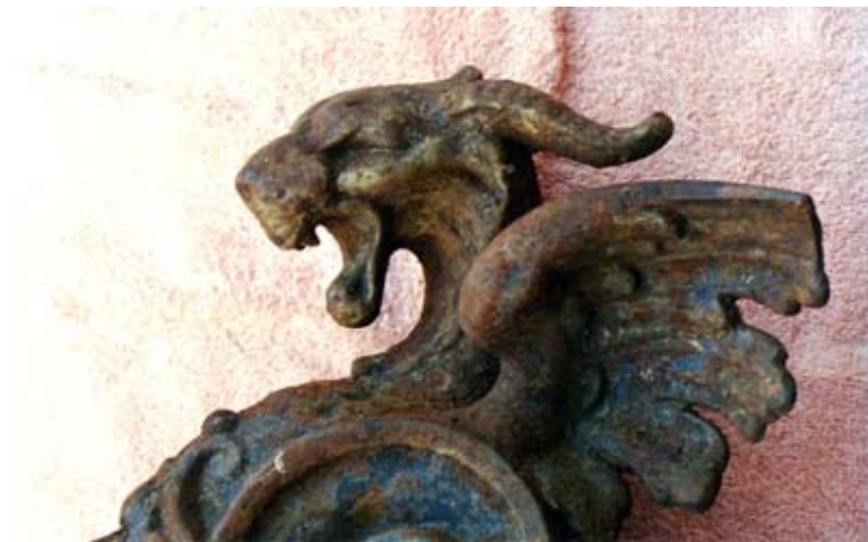
Detalle de la cabeza con cuernos de la figura superior, se observan restos de pintura gris.

Por la curvatura y los restos de hierro unidos a la figura, se dedujo que su función original era de servir de manija lateral de un gran macetero de hierro, típicamente francés y del siglo XIX, a similitud de los muchos que aun adornan edificios públicos de la ciudad de Buenos Aires. Fue una moda en el mundo iniciada hacia 1830, difundida con las grandes exposiciones internacionales europeas en la década de 1850 y que llegó hasta la Primera Guerra Mundial.