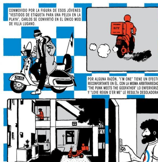
Fonte: Fig. 35. Página 3 de “Canciones cursis...” en Fierro 40 p. 16 (Minaverry)

La letra de la “I’m one” (Soy el único) es una afirmación que realiza un “yo” que podría ser andrógino o desgenerizado. De hecho, el intérprete de se reclama uno en la multitud, tratando de pasar desapercibido y a la vez reafirmando su diferencia pero sin apelar a estereotipos que lo identificarían como varón: