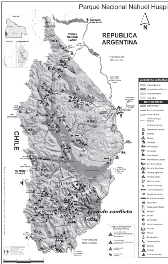
Parque Nacional Nahuel Huapí y área de conflicto