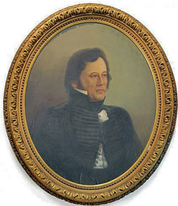
Óleo de Estanislao López de autor anónimo (Museo Histórico Prov. Brig. Gral. Estanislao López)

legales, pero sobre todo entender que cada sociedad halló su solución particular a problemas comunes. Retornamos aquí a la noción ya expresada de adaptación de los postulados teóricos a la realidad local o regional, producto del pensamiento y acción de actores políticos que ponderaban las bondades de la nueva “lengua” pero comprendían el posible error político de su aplicación rígida.