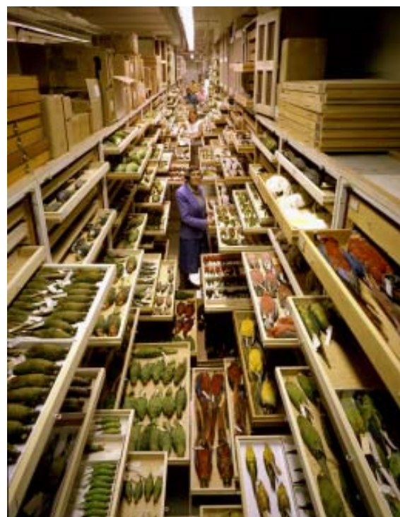
Figura 1. Colección de aves del Smithsonian's National Museum of Natural History.