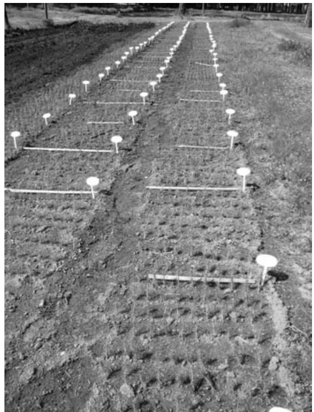
Figura 1. Ensayo de APS de Pino Ponderosa establecido en el Campo Forestal Gral. San Martín del INTA, en Las Golondrinas. Plantas recién repicadas, con 1 año de edad.

En Trevelin la siembra se realizó en 7 surcos longitudinales al almácigo, separados entre sí unos 15 cm. Ya que las plantas no serían repicadas, se dispuso el diseño experimental desde la siembra, que también fue en parcelas completamente aleatorizadas. Por escasez de semillas, dos de las 31 APS no pudieron ser ensayadas en Trevelin. El 12 de marzo de 2009 se realizó la poda de raíces en el sitio, con una cuchilla subsoladora tirada por un tractor a una profundidad de 15 cm. En la semana siguiente se llevó