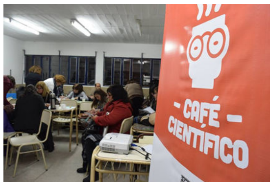
Imagen I. Docentes preparándose para dialogar

En este sentido, apostamos a generar un espacio de intercambio para poder vincularnos entre narraciones, representaciones e imaginarios de profesores, investigadores, en donde se pudiera poner de manifiesto el accionar cotidiano en torno a las trayectorias educativas narradas por estudiantes ingresantes al nivel superior de educación. La descripción de las actividades desarrolladas en el Café que a continuación presentamos, permite visibilizar estos propósitos.