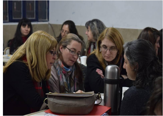
Imagen I y II. Docentes de los CENMA realizando dinámicas propuestas.