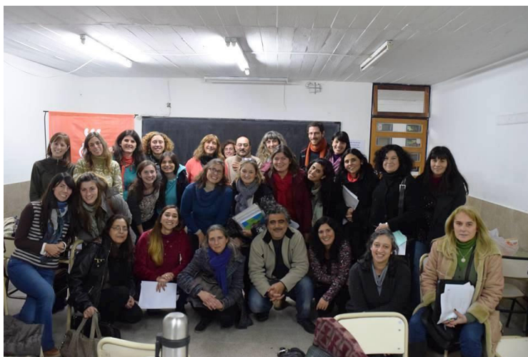
Imagen IV: ¿Quiénes son los científicos?

Desafío final: distinga en la siguiente foto científicos de docentes... 🖥️