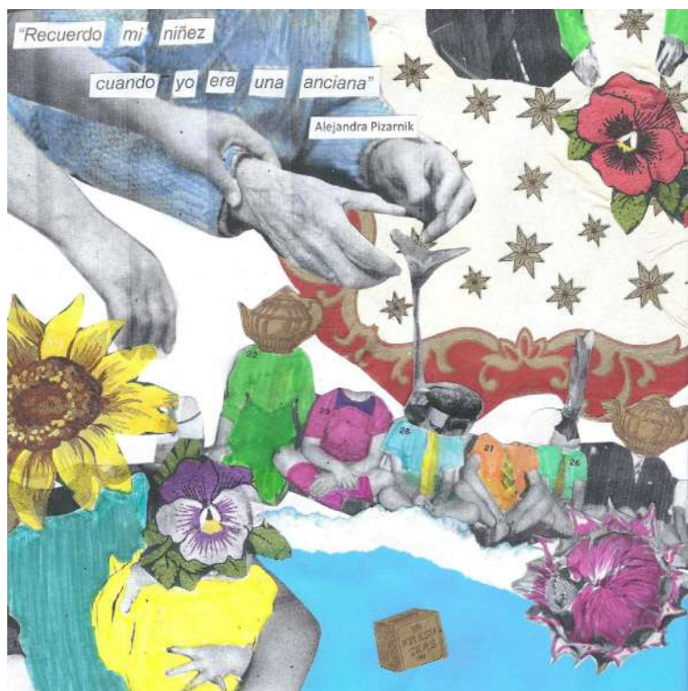
Figura N° 2. S/T.

Estoy parada en un pasillo llorando, el sol de la siesta y el calor cordobés se mezclan con este recuerdo. Una voz me dice 'mijita por qué llora'. Mi mamá salió de casa con mi hermana y no me llevó, y una mujer me consuela tiernamente. Como si fuera un sueño extraño, despierto y soy adulta, me estoy despidiendo de ella porque está muy enferma. Estoy muy triste. Entiendo que no hay sueldo que alcance para pagar lo que se transmite al cuidar, lo que te implica emocional, corporal y afectivamente.