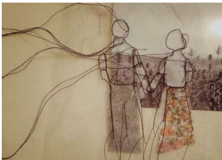
Figura N° 4. Título: Paisaje.

En mi trayecto vital he sido cuidada y sostenida por mujeres de mi familia, entrelazadas y en disputa a veces, las unas con las otras. Y también por mi padre, sosteniendo y prodigando cuidados aún a la distancia forzada que imponía la dictadura militar en mi país. Una pareja inusual, no conviviente y en escenarios cotidianos absoluta y radicalmente diferentes, cuidando a sus dos hijas, una pareja, un paisaje de @criaturacorazón.