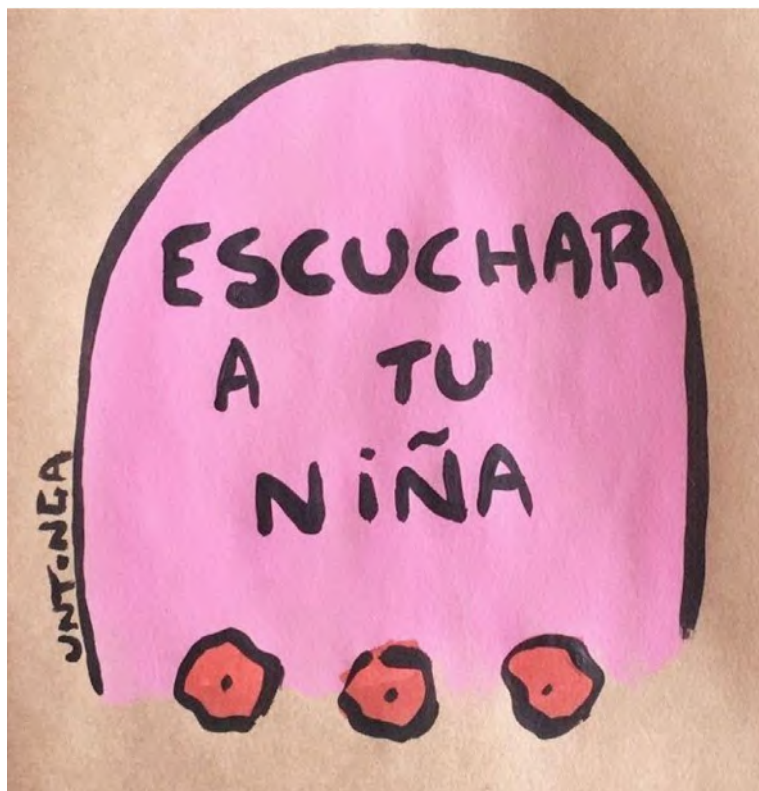
Figura N° 5. S/T.

En los días previos a la defensa de tesis soñé que volvía a la escuela donde hice toda la primaria. Iba de la mano con una niña y la llevaba hasta el salón de 3° año. Hasta allí íbamos y seguíamos recorriendo la escuela, como quien la conoce por primera vez. En el sueño yo aparecía con una niña de la mano, quizás podría ser mi hija, o incluso podría ser yo misma. En mi 3° año escolar sucedió que la maestra recibió, en clase, la noticia de que a su esposo, un militar preso por la dictadura, le habían dado la libertad. La maestra estalló de júbilo ahí mismo y dejó la clase. A ese salón, donde yo había cursado, llevaba a mi niña. Ese año creo que marcó un camino diferente, mostrándome que era necesario expresar con