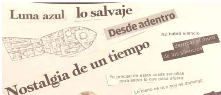
Figura N° 6. S/T.

El tiempo parece lejano, allí en un lugar que no me pertenece. Lo miro desde lejos queriendo atraparlo, conviviendo con la idea de no-tiempo, del tiempo como arte. Pero hace tiempo que no tengo tiempo, con redundancia intencionada. El sistema nos consume teletrabajando y los días comienzan y terminan en una tecla. La tecla B, de Basta. En la pandemia, el capitalismo logró el objetivo final: la aniquilación del tiempo libre. El disfrute pasa por lograr dormir un poquito más sin responder a las teclas o a los ringtones .