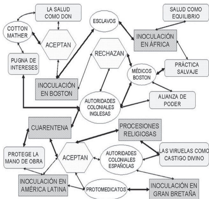
Esquema 1. Configuración sociotécnica de los procedimientos de inoculación implementados en el continente americano durante el siglo XVIII

sustituyó a las prácticas anteriores de aislamiento y cuarentena, de higiene y saneamiento público, o de procesión y oración.