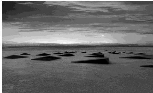
Vista exterior del proyecto Limac. Estudio Productora (2006)

realiza excavando bajo la tierra, utilizando pequeñas aberturas sobre el terreno para el aprovechamiento de la luz y la ventilación.