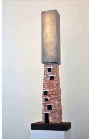
Del Museo de arte Contemporáneo. Cerámica y aluminio (2010)

Estas esculturas no funcionan como maquetas del museo, no son modelos proyectuales para una realización real del Museo, aunque sin embargo no resulta posible desprenderlas de esa referencia a la arquitectura museal contemporánea y a la práctica arquitectónica en sí. Si Frank Gehry ha sido considerado como “el genial escultor de maquetas a escala humana” y si a través de la incorporación de sistemas informáticos ha posibilitado trasladar a la realización arquitectónica formas escultóricas, Cornejo invierte este proceso, la escultura permanece como mera reflexión, imposible de realizarse. La relación entre los distintos materiales, la sensación de completa inestabilidad en las esculturas, representan formas de tensión, de oposición, que clausuran la posibilidad de su realización.