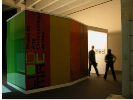
Presentación del Limac en el Musac (2005)

No se realiza una reproducción exacta ni una maqueta de la arquitectura, pero sí son reconocibles los elementos paradigmáticos de este museo: el manejo del color en la fachada y la estructura de sus formas básicas. El espectador encuentra que la arquitectura del Musac, acreedora de grandes premios como el Mies van der Rohe, es tácticamente reutilizada por el museo de la periferia. El museo como objeto simula ser un "apéndice, una extensión, o un tumor" al interior del museo como espacio.