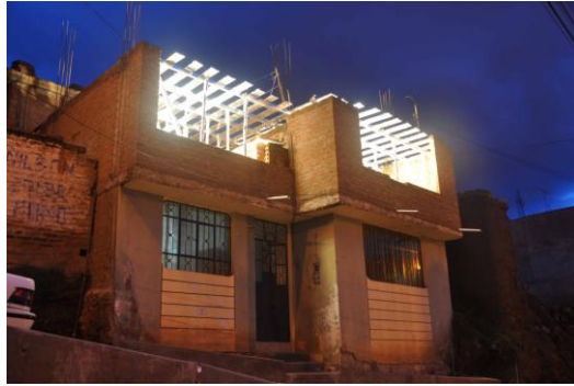
Intervención Puno-Moca en la ciudad de Puno (2011)

En este momento, es interesante la referencia que aparece por el mismo artista al libro El Elogio de la Sombra (1933), de Junichiro Tanizaki. Lo que allí se narra no es sólo la inadecuación de tecnologías occidentales en el Japón sino fundamentalmente los desfases que se generan en la superposición de materiales en el contexto japonés. Lejos de un esencialismo material , Cornejo superpone una construcción que funciona como una crítica tácticamente periférica al lugar del museo dentro de los procesos de transformación urbana. Ese sentido se profundiza en la presentación del aluminio, material sumamente representativo de la producción industrial moderna, opuesto al paisaje de ladrillo, de construcciones sencillas, en la ciudad de Puno.