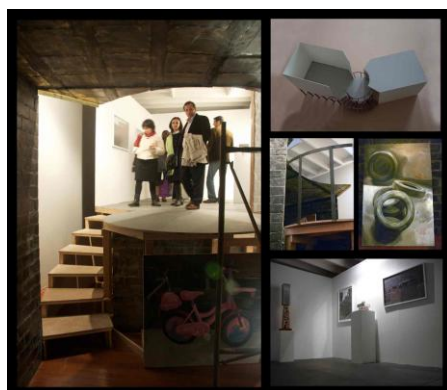
Presentación del Puno-Moca en la galería Lucía de la Puente, Lima (2010)

forma en que el espectador debe recorrer los espacios de las instalaciones. En un pseudo manierismo arquitectónico contemporáneo vemos cómo en el LMCC , en la galería Lucía de la Puente en el año 2010 o en el próximo proyecto a realizarse en Art Basel (2011), el visitante debe recorrer los espacios y no cuenta con ningún punto de visión completa: cada uno de los objetos va develándose paulatinamente, al mismo tiempo en que otros se van ocultando.