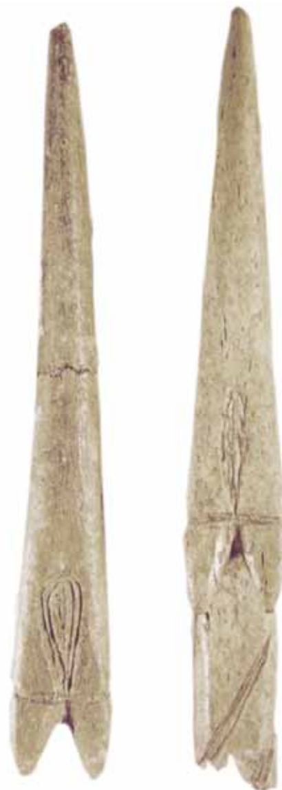
Figura 4. Puntas de arpón bidentadas decoradas con figura con forma de óvalo almendrado, procedentes de los sitios Túnel I (izq.) y Sados (der.), Región del Canal Beagle, Tierra del Fuego. Nótese la similitud de la forma, tamaño, textura, posición y orientación de ambos motivos; su repetición en artefactos de distintos sitios permite sugerir la existencia de una estandarización que podría haber respondido a un código visual en común, tanto estético como simbólico, en cuyo caso podrían haber funcionado como motivos representativos, aparentemente no figurativos.

Figure 3. Circle and three-digit figure engraved on sandstone support at El Rincón site, Region of Margen Norte del río Santa Cruz, Santa Cruz, Argentina. Note the difference in texture between these engravings and the basalt ones in Figure 1, as well as possible differences in the use of scraping and incision techniques. The three-digit figure is commonly considered a figurative representation of a bird track, while the circle is usually seen as a non-representative (abstract) image as it is not associated iconically with any particular referent. However, the figure could also be a non-figurative representative image whose visual code is unknown to us.