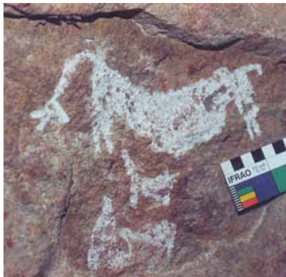
Figura 2. Guanacos pintados del sitio Cueva Grande del Arroyo Feo, Santa Cruz, Argentina. Nótese la similitud en la composición de la escena con la figura 1, respecto de la posición y el tamaño de los animales representados y de su forma general (no así en detalle). Nótese las diferencias de color y textura generadas por la técnica de pintura versus la de grabado.

2b) La potencialidad de las imágenes para transmitir información también puede caracterizarse no solo a partir de la identificación de un referente externo representado de una manera figurativa y reconocible para un observador actual, sino también a partir de la estandarización de los motivos (Llamazares 1992; Fiore 2006). Si sus cualidades plásticas (p. ej., forma, tamaño, posición, etc.), se reproducen en distintos casos (p. ej., entre distintos artefactos decorados, entre distintos paneles de un sitio o de distintos sitios), esta estructura visual similar puede haber posibilitado la transmisión de información, porque su estandarización permite su codificación y decodificación visual (Fiore 2006) y puede haber simultáneamente respondido a códigos subyacentes de composición plástica de la imagen, relativos