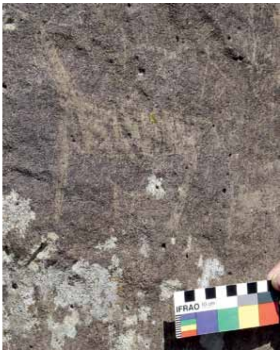
Figura 1. Guanacos (o animales cuadrúpedos) grabados sobre soporte basáltico del sitio Bajada del Dibujo, Región Margen Norte del río Santa Cruz, Santa Cruz, Argentina. Nótese las similitudes en forma de las figuras, las diferencias en tamaño y en posición. Figure 1. Guanacos (or quadrupeds) engraved on basalt at the site of Bajada del Dibujo, Region of Margen Norte del río Santa Cruz, Santa Cruz, Argentina. Note the similar shape of the figures and the different sizes and positioning.

operado de manera distinta, por ejemplo, generando una realidad visual y visible, pero no necesariamente simbólica. Claramente muchos autores usan el término “representación” de una manera más laxa y/o expresando que tienen en cuenta las limitaciones conceptuales de su uso, pero considero importante tener esta problemática en cuenta por las implicaciones teóricas que trae.