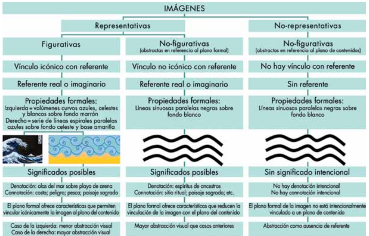
Gráfico 1. Esquema de clasificación de imágenes de acuerdo al plano formal y al plano de contenidos potencialmente representados. Nota: El dibujo de la izquierda corresponde a una de las versiones de la estampa japonesa “La gran ola” del pintor Katsushika Hokusai (publicadas entre 1830-1833).