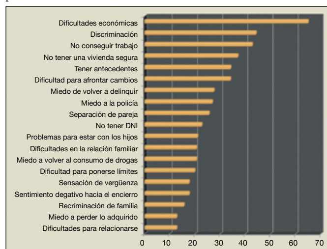
Gráfico 1. Principales estresores psicosociales percibidos en el proceso de reinserción social

Diversos estresores se perciben como sucesos que afectan al liberado durante el período postpenitenciario. El gráfico 1 condensa los principales eventos estresantes que los evaluados han identificado frente a la pregunta: “¿qué situaciones son las que más lo afectan o preocupan desde que recobró la libertad?”