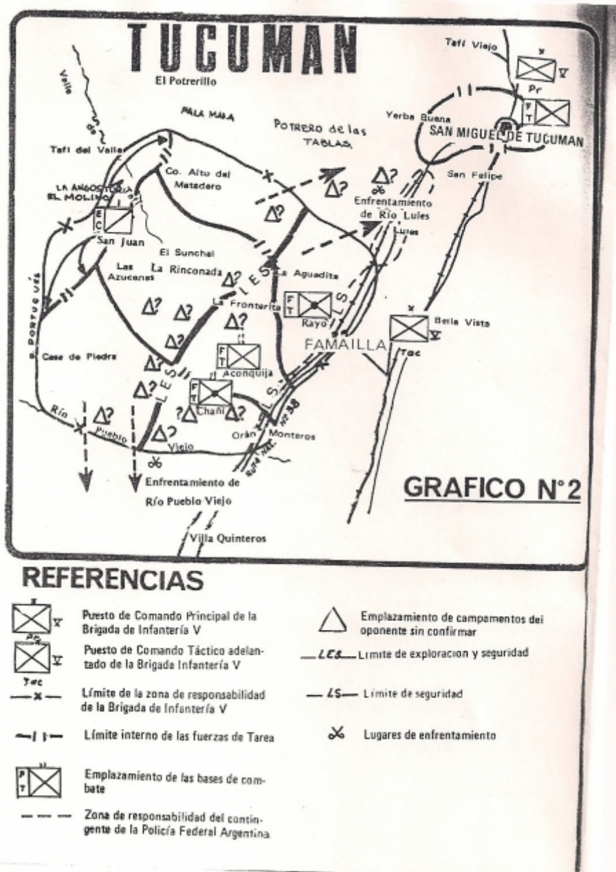
Mapa 2. Tucumán: el hecho histórico. El Plan que posibilitó la victoria contra el Ejército Revolucionario del Pueblo (ERP) en 1975. Tapa y página 6.