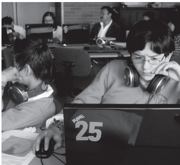
Imagen proyecto con la radio también se aprende. 2010

propuestas de la página que son, a la vez, las del canal. Junto con la venta de artículos de todo tipo comercializados bajo la marca del canal o de los programas que, en su conjunto, conforman segmentos completos de programación, se estructura el proceso que sí encontramos como diferente en relación al pasado reciente: los canales de televisión se constituyen como instituciones anclados en diferentes dispositivos tecnológicos y mediáticos en los que se apoyan para intentar fidelizar a la audiencia.