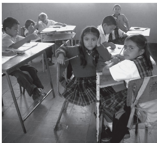
Niños Escuela Rural San Jacinto de Chapa. Proyecto Almas, rostros y paisajes. 2008

La escuela forma parte del universo infantil. Ya sea por concurrir a ella o por estar excluido de ella, es un elemento fundamental de la vida cotidiana por presencia o por ausencia. Los informantes con los que trabajamos y las preocupaciones que, con ellos, abordamos exigían su escolarización para