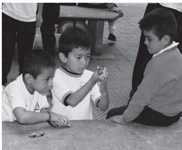
Juguetes en recreo. Hernán Garcés. 2010

Notamos, finalmente, un desplazamiento de los juguetes tradicionales, en una serie que comienza en los informantes de más o menos treinta años pasando por testimonios de informantes que fueron niños en los noventa y llegando a la actualidad. Este desplazamiento tiene un denominador común: los saltos tecnológicos, la miniaturización de la tecnología y el acceso de una parte de la población en estudio a ellos configuran las “nuevas pantallas” como espacios significativos de juego en la cotidianidad infantil. Ya no importa si los niños acceden, efectivamente, a una computadora o a una consola de juegos. El deseo de tenerlos o la ida a casas de amigos que los poseen constituye un escenario nuevo en lo que concierne a los juguetes entendidos como auxiliares de juego. Cuando decimos desplazamiento no estamos marcando la desaparición de los juguetes “tradicionales” del horizonte de la niñez, sino su desplazamiento en los testimonios a favor de los dispositivos tecnológicos que ocupan, cada vez más, un espacio importante en