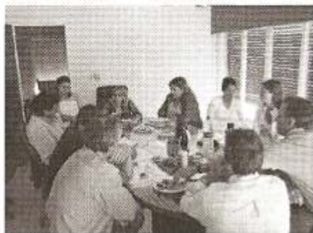
2 -3-Encuentros productivos con escuela Técnica

Técnicos albañiles municipales: el municipio de Villa Paranacito fue el encargado de la construcción de la obra húmeda de las cinco viviendas en el Cerro Poblacional. Se construyeron cinco plateas de hormigón armado y cinco núcleos húmedos. En dichos núcleos se utilizaron los bloques de cemento que el mismo municipio produce. (Figuras 9 y 10)