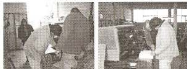
13 y 14- Herrería municipal