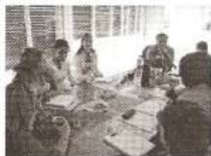
4 -5-Reuniones con técnicos municipales