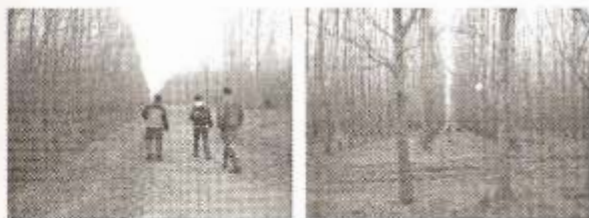
17 y 18- Vista a la producción forestal

El desarrollo está centrado en el conocimiento, no sólo técnico y científico sino también aquel cargado de significaciones culturales, saberes y prácticas populares instaladas en todas las comunidades. La posición epistemológica que asume este trabajo comprende al problema, desde un nuevo planteamiento cognitivo y cultural basado en la capacidad creativa