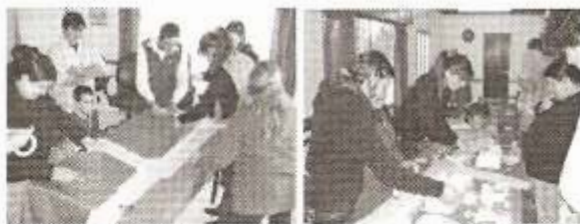
19 y 20- Encuentros Participativos