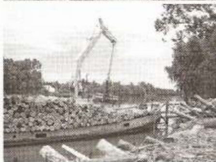
15 y 16- Aserraderos locales

como así también la necesidad de diversificar el destino de la madera de álamo, hoy destinada en su mayoría a pasta para papel. (Figuras 17 y 18)