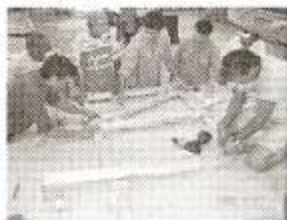
7 y 8 -Encuentros productivos con carpinteros municipales. Fuente: proyecto PID 23121