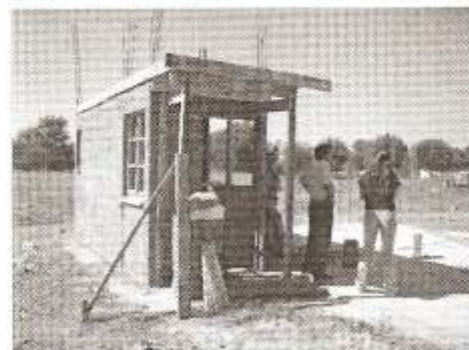
9 y 10- Construcción vía húmeda de la vivienda