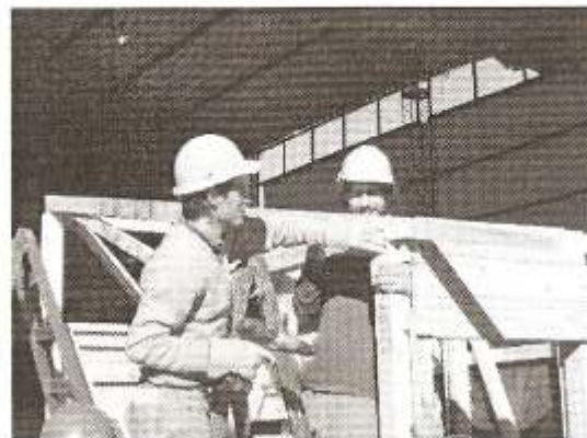
Desarrollo Tecnológico-sede CEVE.