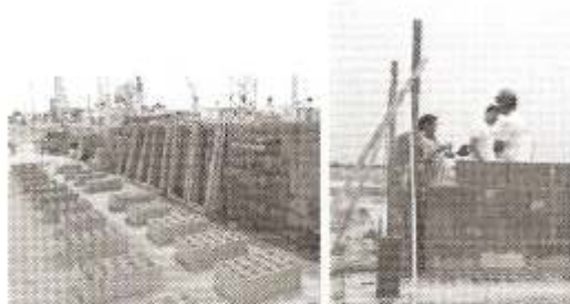
11 y 12 Bloquera municipal. Construcción con bloques de cemento