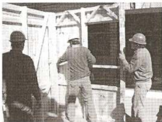
Desarrollo tecnológico-sede CEVE.

Carpintería municipal: el equipo de técnicos y carpinteros que forman parte de la carpintería municipal llevaron adelante la producción de casa partes en madera de álamo. Se realizaron varios talleres entre el equipo de CEVE y los técnicos municipales. En dicho proceso se aprovechó al máximo el aporte de la experiencia y saberes de los carpinteros municipales al producto tecnológico. (Figuras 7 y 8)