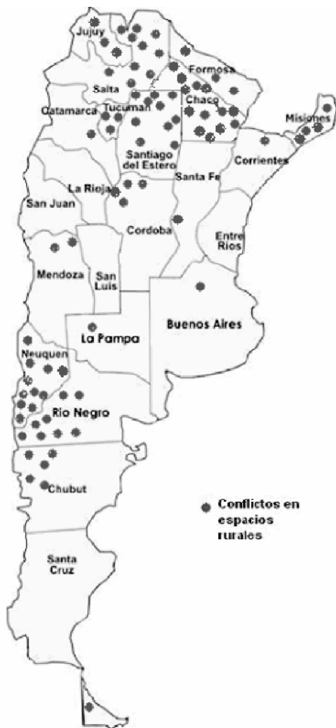
Mapa: Distribución espacial de los conflictos de tierra en la República Argentina, durante los años 2007 y 2008:

*Cada punto es un conflicto en espacios rurales: se toma como referencia la unidad de análisis definida en el capítulo inicial.