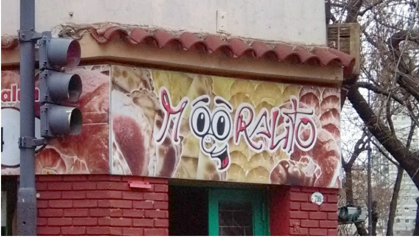
Figura 1. Denominación de un emprendimiento comercial del barrio porteño de San Telmo, expuesta en su cartelera exterior (fotografía de la autora, agosto de 2017).