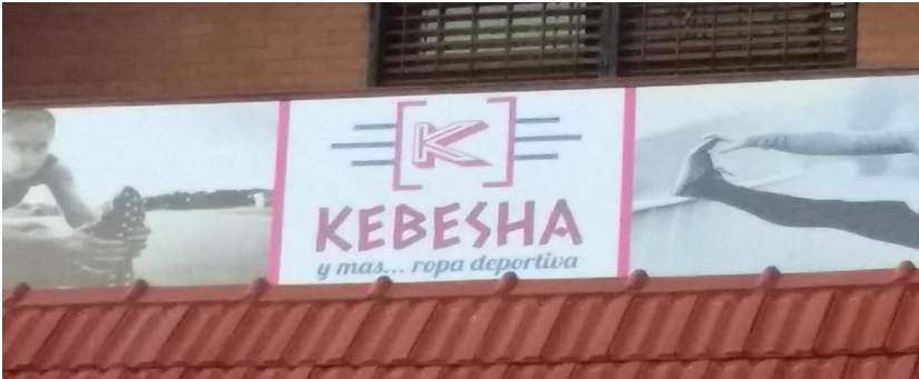
Figura 2. Denominación de un emprendimiento comercial de Bahía Blanca, expuesta en su cartelera exterior (fotografía de la autora, julio de 2017).