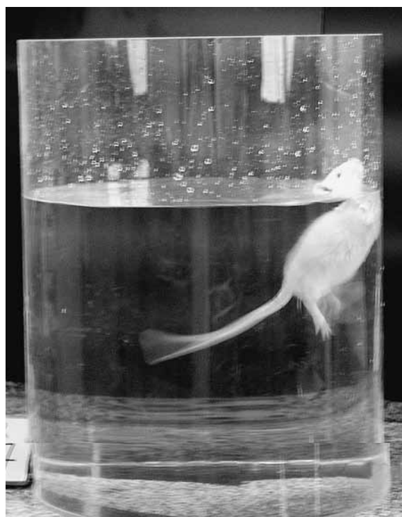
FIGURA 1. Foto tomada en condiciones de laboratorio donde se observa la conducta de "escalada" en la prueba de "natación forzada" de Porsolt 8-11