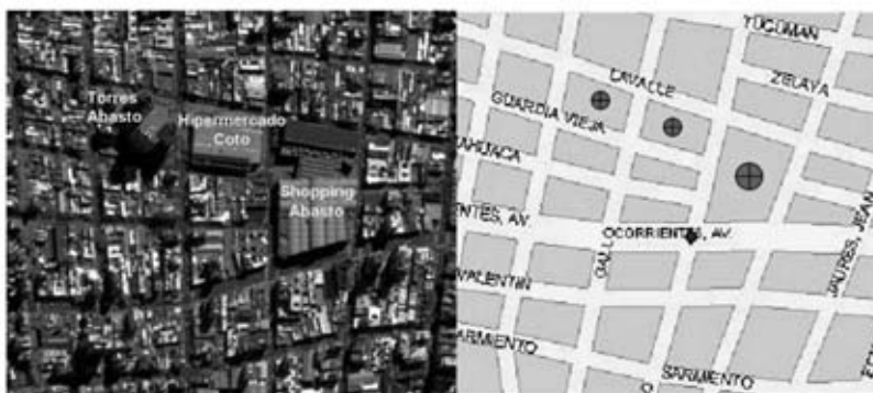
Figura 4 Principales intervenciones urbanísticas del barrio de Abasto

mayor centro comercial del país. Este gran centro comercial se dio a conocer como Shopping Abasto (SA).