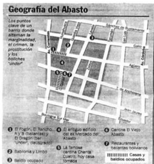
Figura 3 La mirada de la prensa sobre el barrio deteriorado