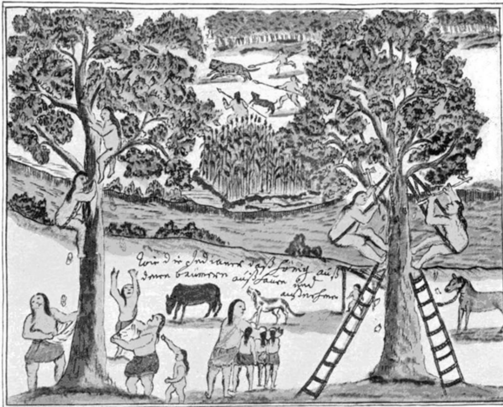
Figura 3: esta imagen se llama "En busca de la miel" y la leyenda expresa: "De cómo los Indios sacan a hacha y retiran de los árboles la miel"