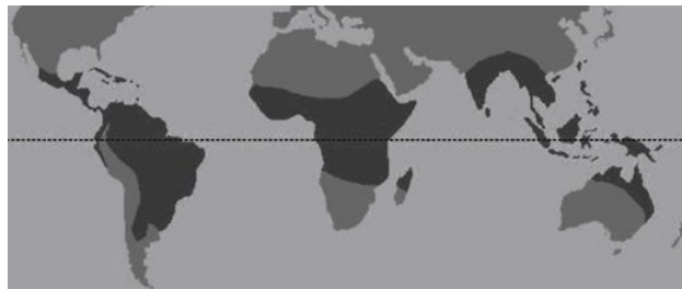
Figura 2: Área de distribución de la tribu Meliponini, en gris oscuro

En la actualidad, los grupos campesinos e indígenas que pueblan las áreas de distribución de estas abejas nativas hacen uso de dicho recurso (Figura 2).