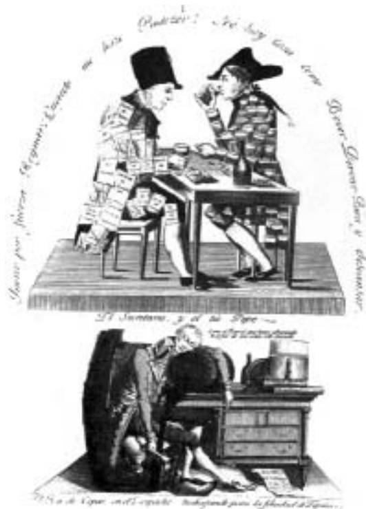
Sátira contra José Bonaparte. Anónimo, grabado al aguafuerte iluminado (Museo Municipal de Madrid, 1808).

Otra imagen satírica que se reproduciría varias veces obtendrá una fuerte acogida en el imaginario de la ciudad. En la imagen se indicaba: “Querer por fuerza Reinar, Cuanto me hace Padecer; No hay cosa como Beber Dormir Bien y Descansar. El Secretario y el Tío Pepe. El Rey de copas en el Despacho trabajando para la felicidad de España”.