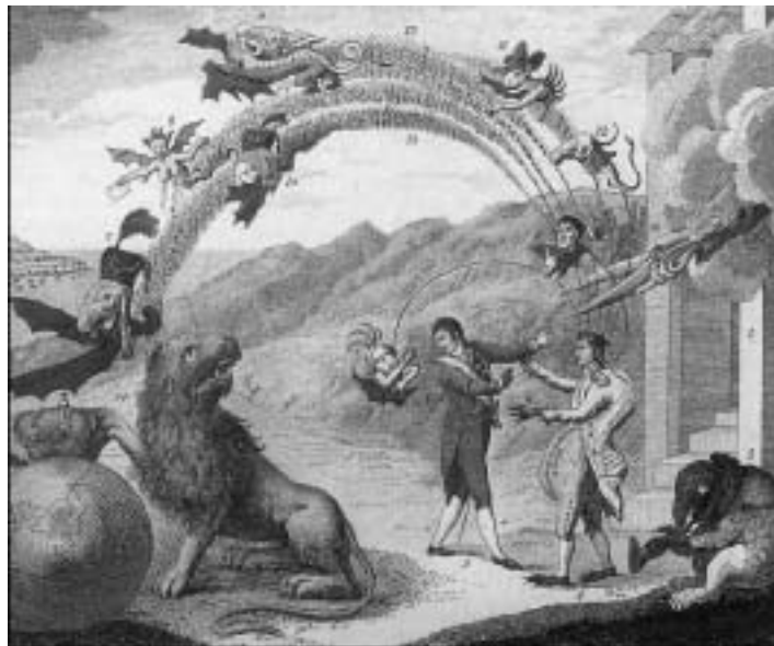
Enigma de las ideas de Napoleón para con la España. Anónimo, grabado al aguafuerte iluminado (Museo Municipal de Madrid, 1808).

Como planteamos anteriormente, en relación a la eficacia de la imagen como estrategia de deslegitimación del Rey Intruso también proliferaron en la ciudad diversas estampas anónimas, centradas en las figuras de José I y su hermano Napoleón. En algunas de ellas aparecen expresiones como: “El enigma de las ideas de Napoleón para con la España” que dan cuenta, a través de las imágenes, de las monstruosidades que pueden engendrarse en la cabeza de Napoleón y su hermano para la Península. El león que representa al Rey cautivo, transmutado en la España misma, intenta comprender sus “complejos y extraños” pensamientos. De esta forma, se satirizaban sus propuestas de reformas políticas y su propio mando. Solo monstruos burlones surgían de sus pensamientos, mientras eran asediados por una tijera “celestial”.