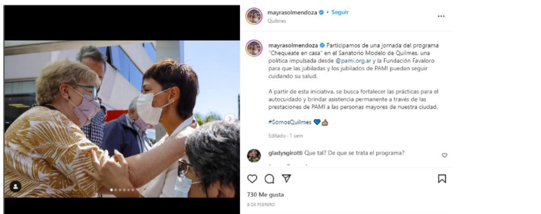
Imagen 3. Cuenta de Instagram de Mayra Mendoza el 8 de febrero de 2022.

De este modo, podemos observar que la interacción de las múltiples materias significantes, la corporalidad de la intendenta se muestra empalmada con otras mujeres del gobierno nacional y los programas que dirigen. Asimismo, la interpelación se produce también a mujeres internautas. En definitiva, por un lado, el vínculo de la intendenta con la jubilada emerge directo para una internauta que visita fugazmente su feed deteniéndose únicamente en la fotografía. Es decir, se interpela a una «internauta seguidora local». Por otro lado, el vínculo con las ciudadanas aparece intermediado por mujeres del gobierno nacional para las internautas seguidoras regulares que interac-