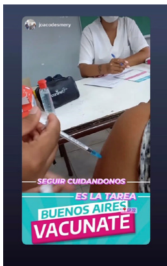
Imagen 6. Captura de story publicada desde la cuenta de Mayra Mendoza en Instagram.

del texto lingüístico: «Buenos Aires vacunate» como a las consignas: «seguir cuidándonos es la tarea».