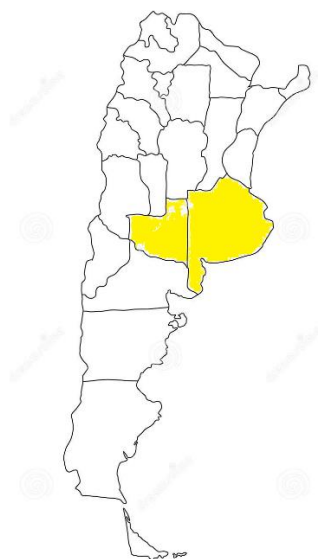
Figura 1: Provincias de La Pampa y Buenos Aires resaltadas en amarillo en el mapa de Argentina.