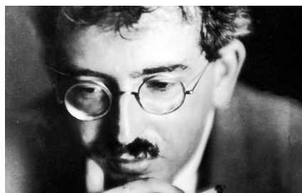
( https://riberas.uner.edu.ar/pasaje-cordoba-berlin-1915/2015_42_walter_benjamin/ )

El tránsito de una universidad profesionalista a una Universidad "socrática" no es en Deodoro únicamente una simple reconversión institucional sino un espíritu orientado a la transformación social. "Pienso -escribe- que en las universidades está el secreto de las grandes transformaciones. Ir a nuestras