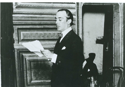
( https://riberas.uner.edu.ar/pasaje-cordoba-berlin-1915/1200px-deodoro_roca/ )

Lejos de la desconfianza de Benjamin frente a la condición estudiantil de su tiempo, quien sería el mentor de la Reforma universitaria de 1918 considera a los estudiantes en otros términos y con otro tono, pues al menos en esos años - aún ajeno a la desesperanza con la que autointerpreta la Reforma durante los años treinta-, Deodoro refiere a la juventud estudiosa como el sujeto político destinado a producir un cambio socio-cultural cuya radicalidad desbordaría las universidades pero tendría en ellas su origen. ¿Qué es una generación? ¿Cuáles son sus tareas? ¿Cómo es su relación con una herencia? ¿De qué modo reivindicar el derecho a una experiencia propia ? Esta secuencia de preguntas establece sin embargo una nítida y extraña comunión entre ambos e irrumpen con intensidad en una circunstancia de "bancarrotta moral" y necesidad de acuñar otras "fuerzas morales" -según el léxico de José Ingenieros, decisivo en la prosa de Roca.