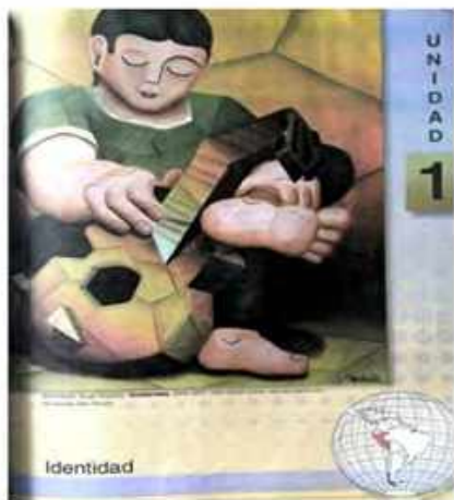
El arte de leer, Unidad 1 (Piccanço y Villalba, 2010: 7)

En el período estudiado (2003-2015) se tomaron medidas glotopolíticas distintas relativas a la valoración del portugués en Argentina y del español en Brasil como lenguas extranjeras en la enseñanza media. La comparación mostró que las intervenciones del lado brasileño fueron más significativas, sobre todo en la producción de orientaciones curriculares específicas y selección de manuales escolares. Así, en Brasil se llevó adelante un dirigismo glotopolítico que apuntó a trabajar sobre las representaciones del español, visibilizando su heterogeneidad y combatiendo los prejuicios y estereotipos que habían sobrevalorado la variedad peninsular. Si bien esta