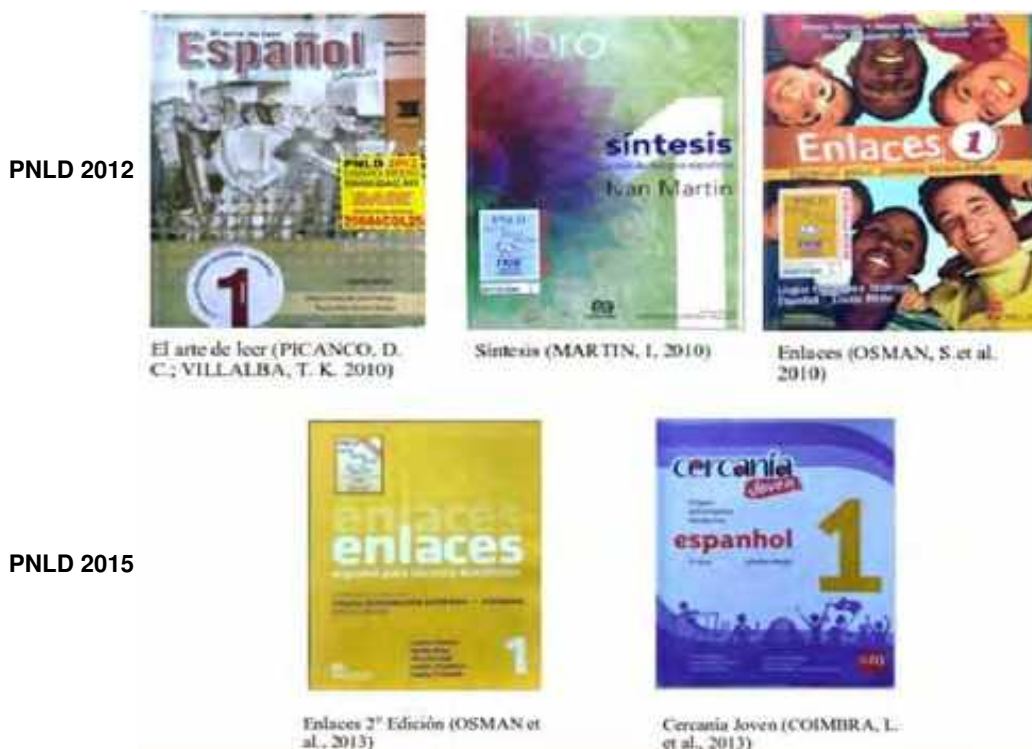
Imagen Nº 2: Manuales de español seleccionados en las convocatorias 2012 y 2015 del Programa Nacional do Livro Didático do Ensino Médio (Brasil)

Como podemos observar, al contrastar las tapas de los manuales y los títulos existe una gran diferencia en la representación del portugués y del español en cada caso ( Ver imágenes Nº 1 y 2 ). Los manuales de portugués por medio de los títulos, colores de las tapas e imágenes acentúan la relación del portugués como lengua nacional de Brasil, ideología que hemos identificado como nacionalismo lingüístico brasileño (Rubio Scola, 2019b)