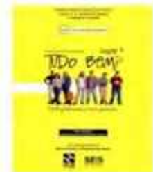
Tudo Bem? (DE PONCE et al., 2010)