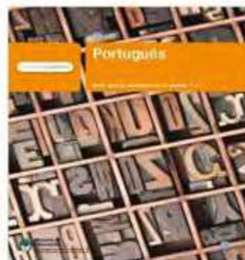
Português, Modelo 1 a 1 (Correa y Rodríguez, 2011)