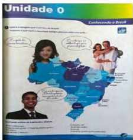
Brasil-ilsa. En: Unidad 0. Brasil Intercultural Ciclo Básico (2013: 5)

La marcada separación de Brasil de la región en los manuales de portugués instaló una evidencia difícil de problematizar y cuestionar para poder pensar a este país como parte constitutiva de la región. Así también lo destacaron Lessa (2013) y Lima (2013) en los manuales de español de la enseñanza privada en los que se reproduce el silenciamiento de la pertenencia de Brasil al continente latinoamericano. La conformación del Mercosur y luego las políticas a favor de una integración estratégica en el periodo analizado tuvieron escasos efectos a nivel glotopolítico en las ideologías vehiculizadas por los manuales de portugués que circularon en Argentina.