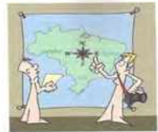
Novo Avenida Brasil (Lima et al. 2009)