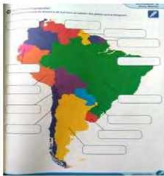
Brasil en América del Sur En: Unidad 2. Brasil Intercultural Ciclo Básico (2013: 43)