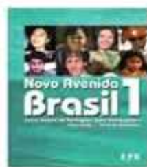
Novo Avenido Brasil (LIMA; ROHRMANN, 2008)