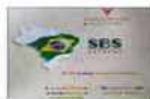
Bem-vindo! (Ponce et al. 2008)