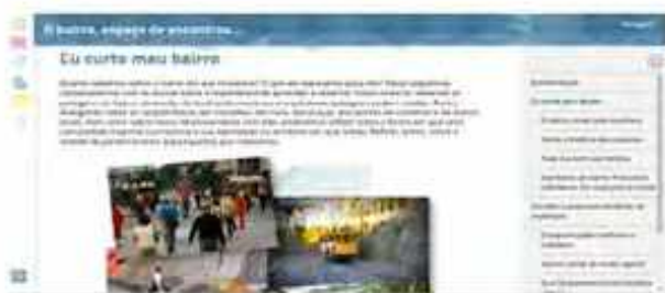
O bairro, espaço de encontros... Entrama (Correa et. al. 2015)