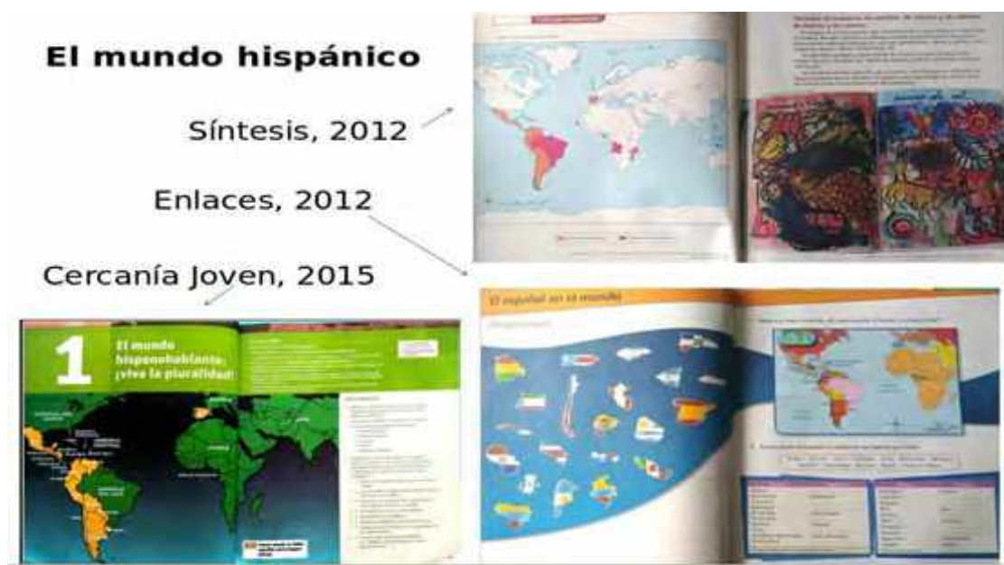
Imagen N°6: Mapas del español en el mundo

(...) esta colección te brinda la oportunidad de conocer el mundo hispánico desde varias miradas (...) ¿Sabías que el español es una de las lenguas más habladas en el mundo y es la lengua oficial de la mayoría de los países vecinos de Brasil? (...) ¡Bienvenido al mundo hispanohablante! (Cercanía Joven - Coimbra et al., 2013)