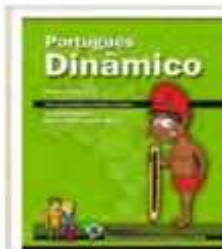
Português Dinâmico (ANDRÉ; SANTA MARIA, 2011)