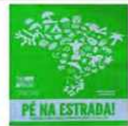
Pé na Estrada (RODRIGUES; SANTANA, 2015)