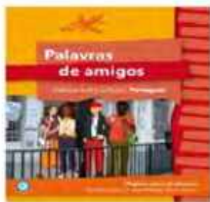
Palavras de amigos, Páginas para el alumno (Ferradas, 2009)