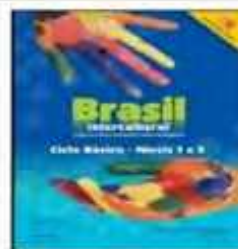
Brasil Intercultural (BARBOSA; DE CASTRO, 2013)