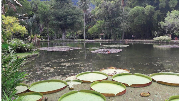
Imagen 1. Lago en el centro del Jardín Botánico de Río de Janeiro. El lago se decora entre lirios de agua e impresionantes ninfas reales ( Victoria cruciana ) de gran diámetro.