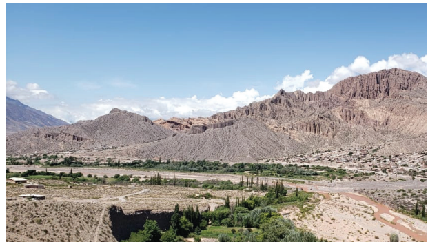
Imagen 11. En la fotografía se observa el paisaje de los alrededores del Tilcara (Jujuy, Argentina) desde el Jardín Botánico de Altura. El clima es seco y templado en los sectores cercanos a la quebrada y a medida que se asciende a las cumbres la temperatura disminuye bruscamente. La vegetación pobre presenta algunas especies como molles, sauces, álamos y acacias en los valles fértiles. En cuanto a la fauna dominan vicuñas, guanacos, águilas, vizcachas, entre otros.