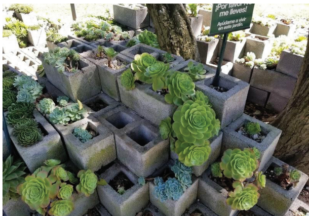
Imagen 9. Variedades de suculentas y crasas en macetas en el Jardín Botánico del Bosque de Chapultepec. En la parte superior derecha se observa un cartel que dice: “¡Por favor no me lleves! Ayúdame a vivir en este jardín”.