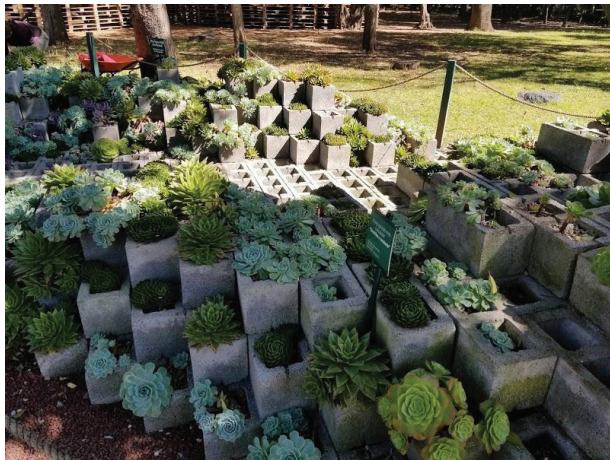
Imagen 8. Variedades de suculentas y crasas en macetas en el Jardín Botánico del Bosque de Chapultepec.