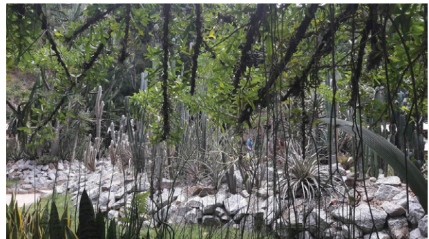
Imagen 6. Más imágenes de la colección de Cactáceas en el Jardín Botánico de Río de Janeiro.