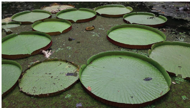
Imagen 2. Lago en el centro del Jardín Botánico de Río de Janeiro. Imagen ampliada de ninfas ( Victoria cruciana ).