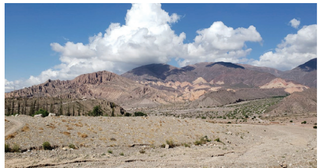
Imagen 12. En la fotografía se observa el paisaje de los alrededores del Tilcara (Jujuy, Argentina) desde el Jardín Botánico de Altura.