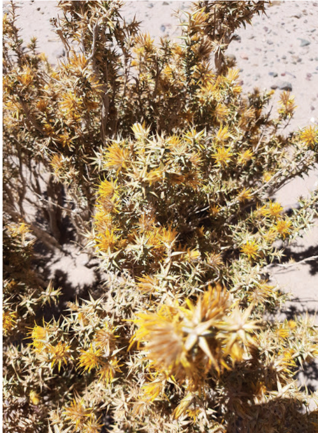
Imagen 13. En la fotografía se observa la especie Chuquiraga erinacea conocida vulgarmente como uña de gato perteneciente a la familia Asteraceae.