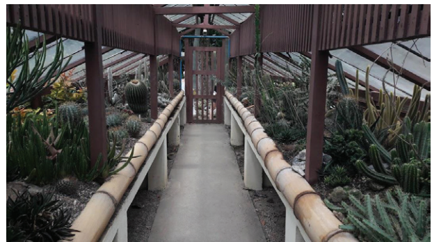
Imagen 5. Parte de la colección de Cactáceas en el Jardín Botánico de Río de Janeiro. En la imagen se observan diferentes especies de cactus. El cactario perteneciente al jb alberga más de 1000 especies de cactus traídos de diferentes partes de América en su mayoría y un porcentaje menor al resto del mundo, principalmente África.