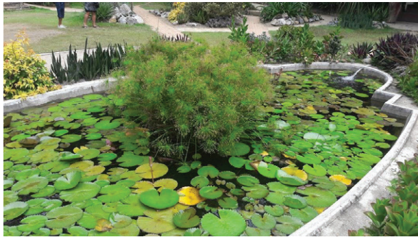
Imagen 3. Pequeño estanque en el Jardín Botánico de Río de Janeiro. En la imagen se observan pequeñas ninfas acuáticas y en los costados crasas, suculentas y sansiverias.