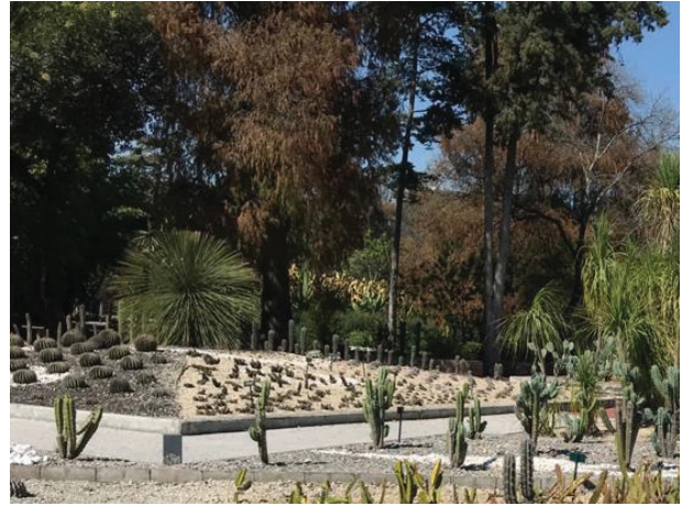
Imagen 10. Variedades de cactus y hacia el fondo algunos miembros de la familia Areaceae en el Jardín Botánico del Bosque de Chapultepec.