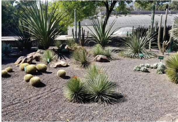
Imagen 7. Algunas Cactáceas en el Jardín Botánico del Bosque de Chapultepec.