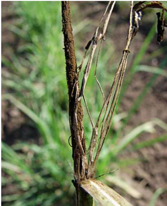
4. Exposición de las esporas de carbón luego de la ruptura de la membrana que las recubre. Sección Fitopatología, EEAOC.