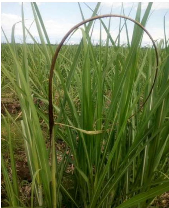
Figura 3. Síntoma típico del carbón (látigo) en el ápice de tallos de caña de azúcar. Sección Fitopatología, EEAOC