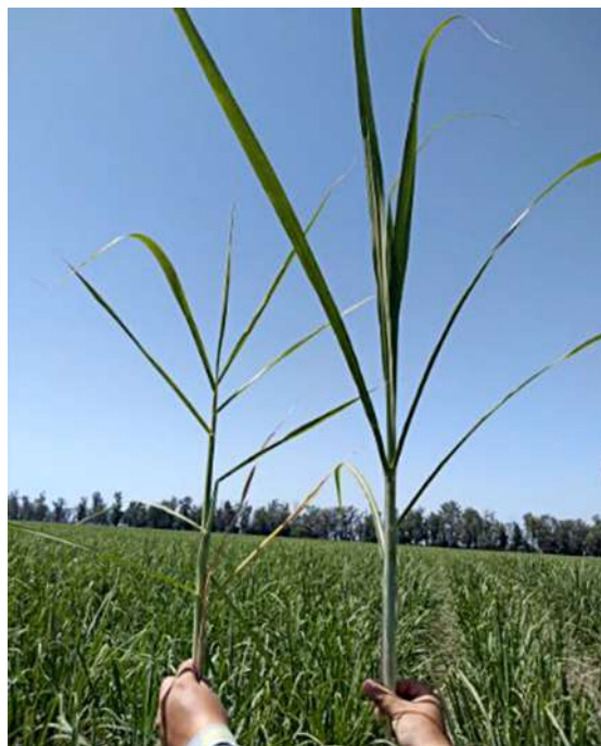
Figura 2. Comparación de un tallo de caña de azúcar afectado con carbón (izquierda) y un tallo sano (derecha). Sección Fitopatología, EEAOC