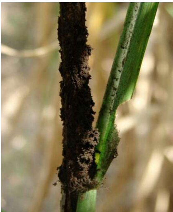
Figura 1. Detalle de las masas de esporas de color marrón producidas por Sporisorium scitamineum en un tallo de la caña de azúcar afectado por carbón. Sección Fitopatología, EEAOC.