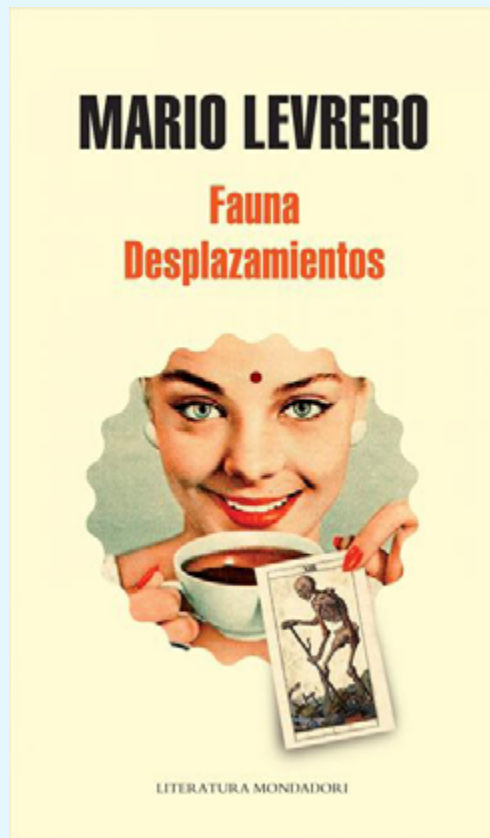
Figura 3. Cubierta de Fauna / Desplazamientos (Levrero, 2012a)

Fauna narra un caso de terapia parapsicológica que se estructura a modo de una investigación detectivesca. Es decir, concentra las dos series que De Rosso (2013) señala como las que más perduran en la trayectoria del uruguayo: la esotérica y la policial. A su vez, coincidimos con el crítico cuando la coloca entre los libros donde predomina lo esotérico, ya que la proliferación de dobles y los enigmas que presenta la novela se resuelven recurriendo a conceptos del Manual , más precisamente, la proso-popesis. En Fauna los personajes femeninos, configurados como ánimas junguianas tan recurrentes en su narrativa (Corbellini, 1996), se componen a partir de esta noción. El ánima, esa especie de monstruo bifronte que implica la salvación y la perdición y reúne la imagen de la madre y de la prostituta, en este caso adquiere la silueta aparente de dos hermanas: Flora, aniñada y retraída, y Fauna, de desbordante sexualidad. El protagonista, un escritor que trabaja en un quiosco, recibe la inesperada visita de la última, quien le pide que inicie una terapia con su hermana, ya que sabe que tiene conocimientos de parapsicología, pues ha escrito artículos periodísticos sobre la disciplina.