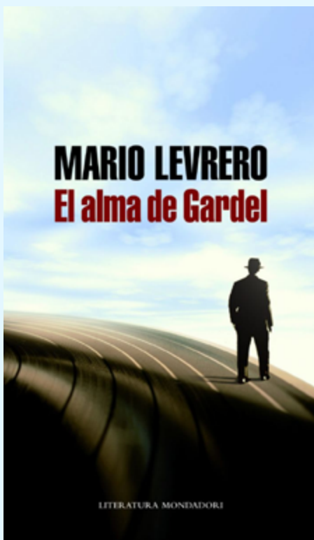
Figura 4. Cubierta de El alma de Gardel (Levrero, 2012b)

que se sugestionen mutuamente los estados de ánimo, estableciendo una situación de comunicación extranormal» (2019, p. 8).