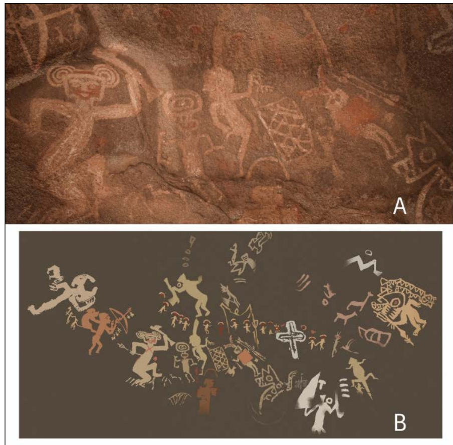
Figura 2. (A) Fotografía del interior del alero La Sixtina; (B) Calco digital de los motivos pintados en el alero La Sixtina.

hicieron presentes autoridades del gobierno provincial, entre las que podemos destacar a la entonces gobernadora de la provincia de Catamarca, doctora Lucía Corpacci y el actual gobernador, por entonces intendente de la Municipalidad de San Fernando del Valle de Catamarca, Lic. Raúl Jalil.