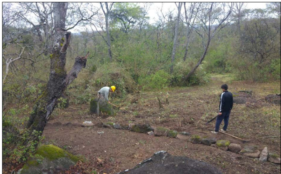
Figura 8. Trabajos orientados a definir el Sendero "Camino de las Casas de Piedra", actividad realizada junto a miembros de la comunidad.

Los rasgos topográficos permitieron conseguir un trazado que incorpora curvas y suaves cambios de pendiente que generan en el visitante un clima de curiosidad y misterio debido a la dificultad de observar lo que se encuentra más adelante (Morales Miranda y Ham, 1992). Si bien se recomienda que el tiempo de recorrido no exceda los