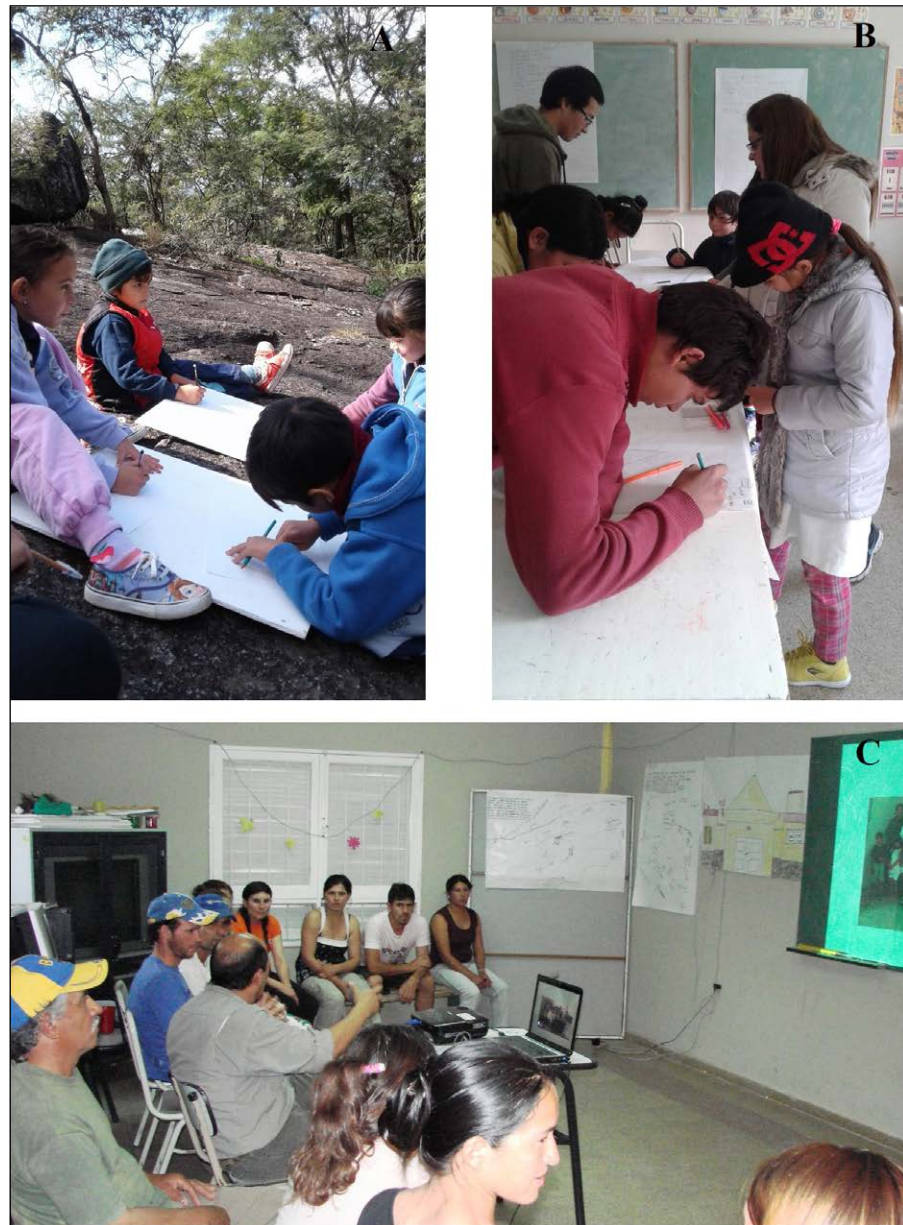
Figura 4. (A) y (B) Taller orientado a la Conservación Preventiva del arte rupestre de La Tunita, en el que participaron los niños que asisten a la Escuela N° 37 junto a sus padres y hermanos (Nazar et al. 2019); (C) Taller de Cartografía Patrimonial (año 2011).

un proceso de activación patrimonial gestado desde afuera, sino que se necesitan comunidades organizadas y con voluntad de reapropiarse de su pasado y empoderarse de su futuro a través del patrimonio (Figura 4).