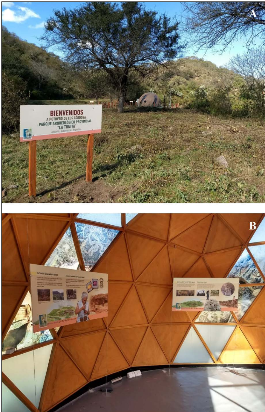
Figura 3. Centro de Interpretación de Potrero de los Córdoba, exterior (A) e interior (B).

tanto, prestamos atención a espacios productivos, viviendas residenciales, arquitectura pública, arte rupestre y demás materialidades y sus contextos.