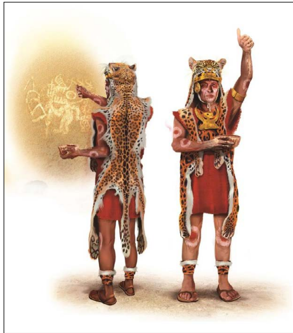
Figura 6. Proceso creativo de la imagen del chaman pintor.