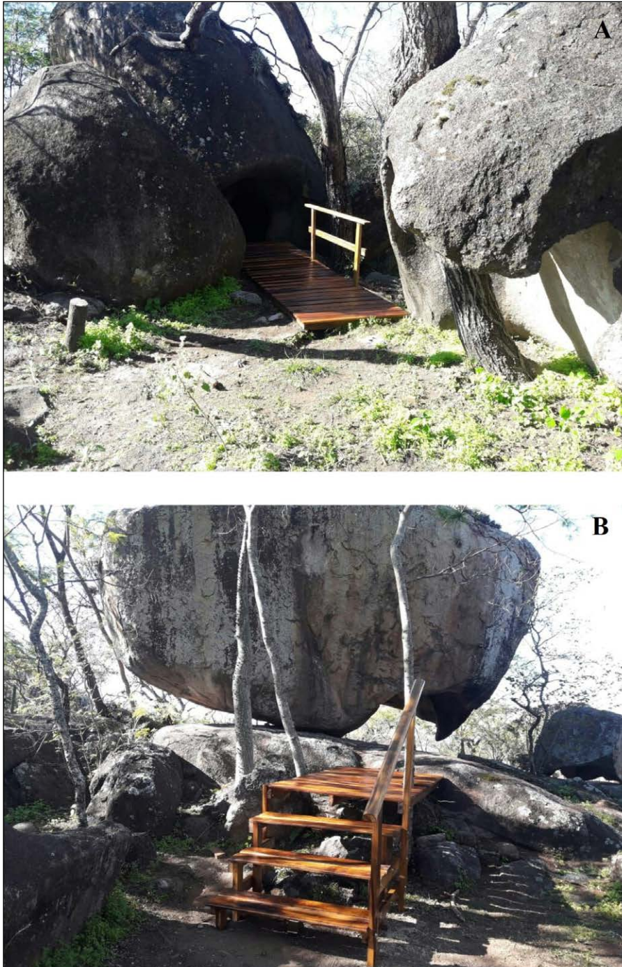
Figura 10. Trabajos de acondicionamiento para la visita pública. (A) sector El Hornero, (B) sector La Sixtina.