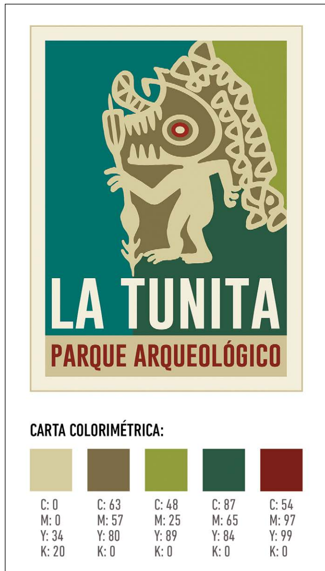
Figura 5. Isotipo del Parque Arqueológico Provincial La Tunita con su respectiva escala de referencias.

dar cuenta de los atributos felínicos que impregnan a varios personajes de La Tunita. En este caso, también se consideraron aditamentos cefálicos realizados en cueros de felinos que forman parte de las colecciones de museos chilenos: Museo Arqueológico Miguel de Azapa y Museo Gustavo Le Paige de San Pedro de Atacama (Horta Tricallotis, 2014, Figura 12b, p. 574).