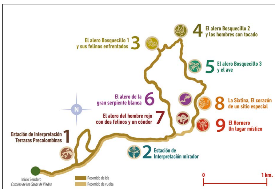
Figura 9. Plano del Sendero "Camino de las Casas de Piedra" con sus respectivos Puntos y Estaciones de interpretación.

La articulación de los distintos puntos de interpretación se realizó aprovechando las huellas del ganado que la gente de los puestos vecinos cría en el bosque. Se procuró acotar el recorrido a aquellos sitios con arte rupestre que mostraban conexión espacial, cierta complementariedad temática y que venían siendo visitados de manera informal. No obstante, cabe destacar que la distribución del arte rupestre y otros posibles puntos de interpretación presenta un gran potencial para ampliar la propuesta de uso público, siempre que los objetivos de conservación y la capacidad de manejo así lo permitan.