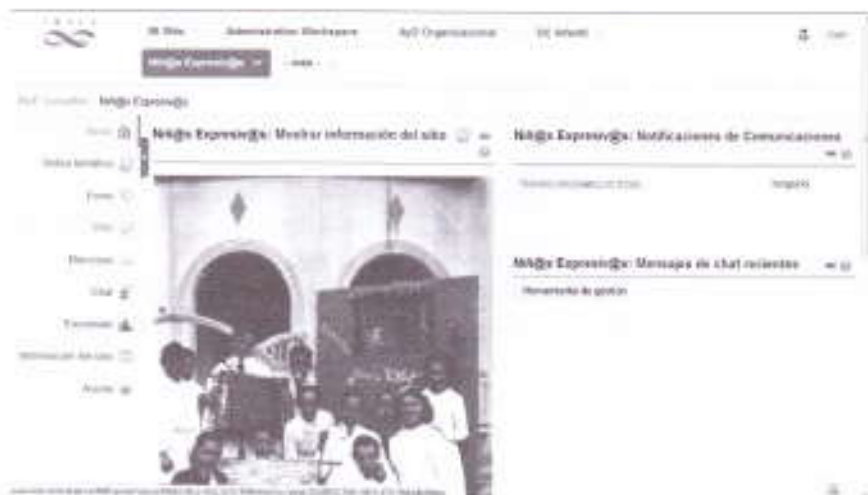
Portail du site interactif « Niñ@s Expresiv@s » (Enfants créatifs).

En bas de toutes les pages des clés d'entrée, on trouve des liens vers l'index thématique et les outils interactifs. Pour accéder à ce dernier lien, il faut créer un compte usager dans l'environnement Sakai CLE. La procédure en est expliquée dans un autre lien. Le document présente, à titre d'exemple, une des pages d'accès vers « Niñ@s Expresiv@s » 6 , sur laquelle on peut télécharger les cahiers complets de plusieurs élèves durant la période 1935-1950. Les participants, une fois reconnus sur la plate-forme, peuvent changer de site interactif en cliquant sur le nom