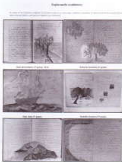
Cahiers créatifs.

ment de ce dispositif interpelle en profondeur notre manière de nous légitimer comme une communauté, ce qui requiert la construction d'un savoir-faire éthique.