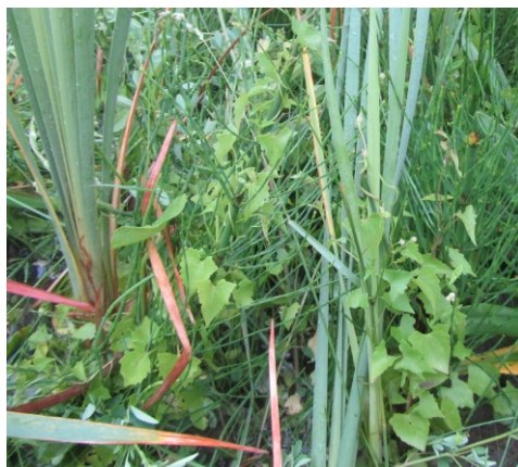
Fig. 5. Mikania parodii en su ambiente natural del SE bonaerense.