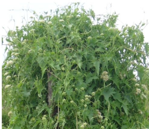
Fig. 4. Mikania periplocifolia (Asteraceae).