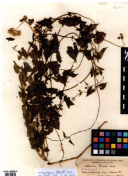
Fig. 1: Material típico de Mikania parodii .

apuntamos a señalar ciertas diferencias fitoquímicas y discontinuidades fenotípicas morfológicas de estas 2 especies.