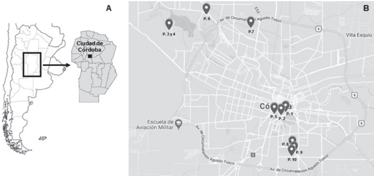
Figura 1. Ubicación de la ciudad de Córdoba (longitud: 064^{\circ}10'51.78'' y latitud: S31^{\circ}24'48.6'' ), provincia de Córdoba, centro de Argentina (A). Mapa de localización de cada una de las piscinas muestreadas (📍) dentro de la ciudad de Córdoba (B).

Las muestras se recolectaron en el período comprendido entre los meses de diciembre de 2017 y marzo de 2018. El procesamiento y análisis se realizó en el Laboratorio de Parasitología, Facultad de Ciencias Químicas, de la Universidad Católica de Córdoba.