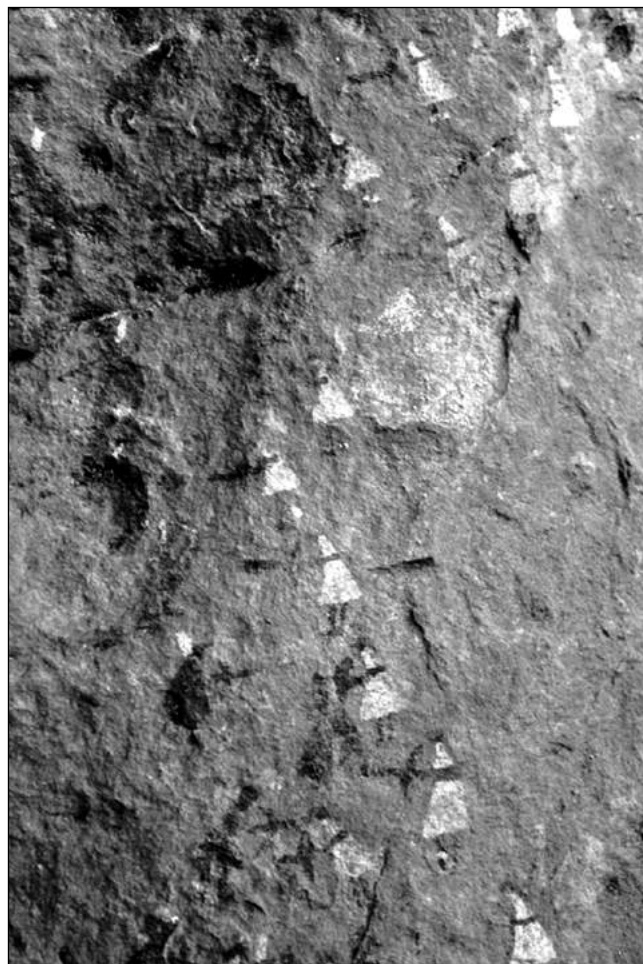
Fig. 6. Escenas de batalla registradas en Cueva del indio. a. Enfrentamiento entre antropomorfos en negro y antropomorfos en blanco.