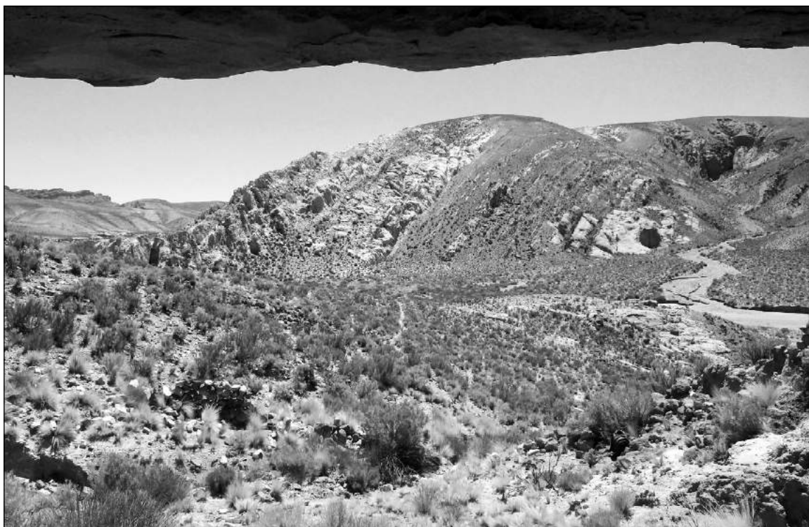
Fig 2. Vista general de la Quebrada de Humahuaca en la zona de Tres Cruces.