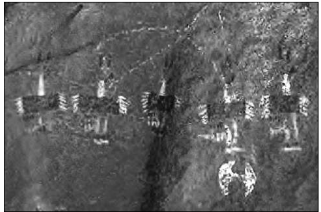
Fig. 8a. "Emplumados" semejantes a Samilantes, sitio Coctaca.