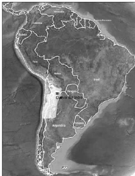
Localización de los Andes Centro-Sur