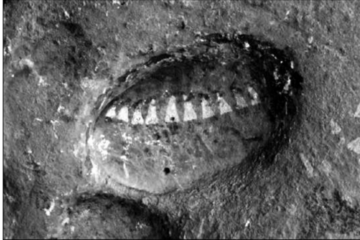
Fig. 6. Escenas de batalla registradas en Cueva del indio. b. Detalle de la "emboscada".