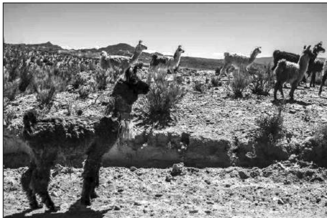
Fig. 3. Rebaño de llamas en el norte de la Quebrada de Humahuaca con pompones en las orejas y en el cuello, marcas de "señalada" actuales.