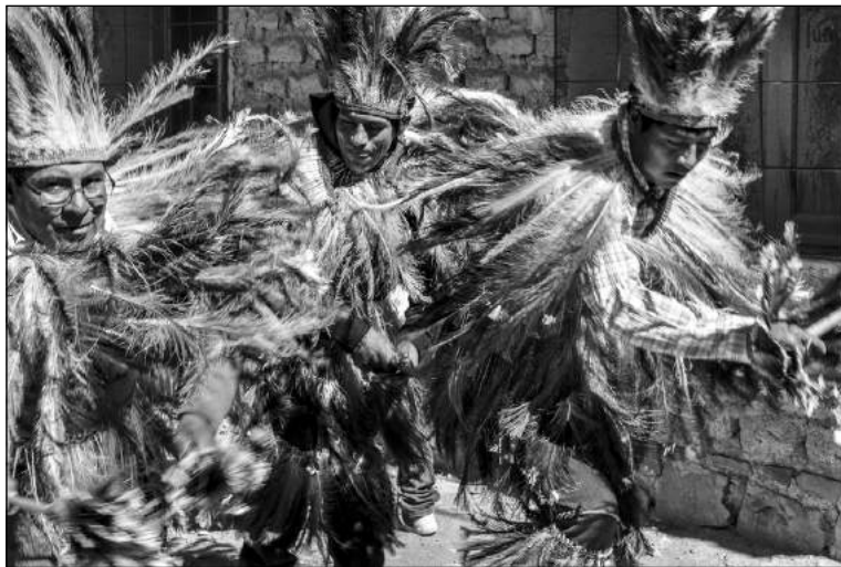
Fig. 8b. "Samilantes" en rituales actuales, hombres en una danza de alabanza a la virgen vestidos con plumas de suri ( Rhea pennata - ñandú andino).