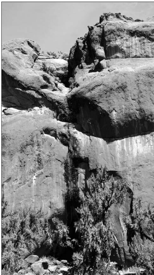
Fig. 5. Vista de la entrada de la Cueva del Indio.