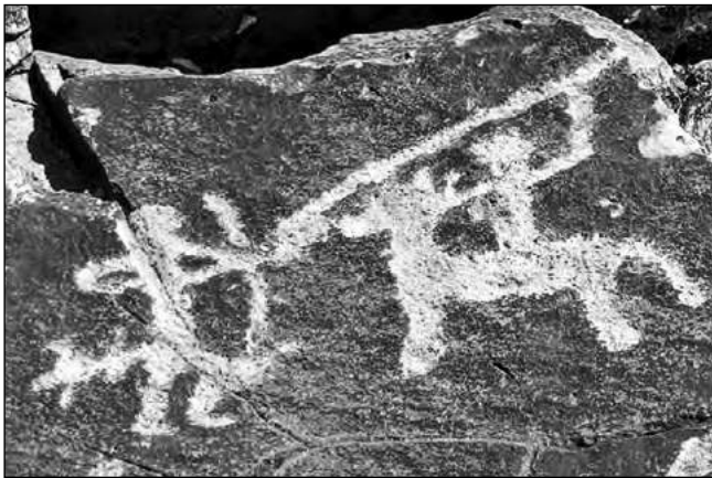
Fig. 7. Escena de enfrentamiento entre un guerrero indígena y un invasor español a caballo, registrada en Sapagua.