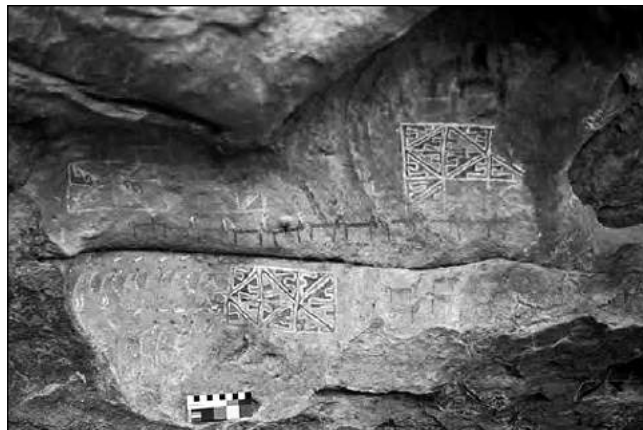
Fig. 4. Detalle del Abrigo de los Emplumados con llamas "marcadas" con pompones, diseños geométricos y antropomorfos con atuendos emplumados.