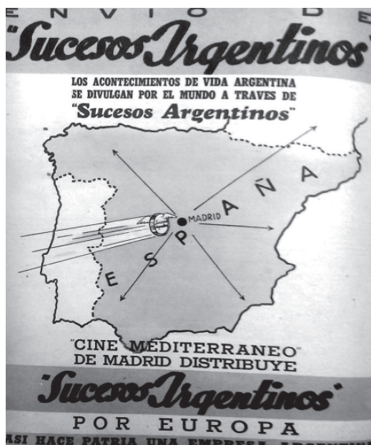
Imagen 1. Publicidad en Cine Argentino – 19 de febrero de 1942.

Antes del surgimiento del No-Do, se promulgó en 1942 un acuerdo comercial entre Argentina y España, en el que se propone con «urgencia de promover una íntima colaboración cultural entre España y Argentina, con el propósito de fortalecer la defensa y jerarquía de los inmutables valores del espíritu que le son comunes y que forman la base más sólida de sus respectivas nacionalidades». 12 En este contexto, la industria cinematográfica de ambas naciones comienza a desarrollar relaciones económicas, comerciales y artísticas. Entre otras, se destacan los intentos de Antonio Ángel Díaz y del gobierno argentino desde 1941 para proyectar los Sucesos Argentinos en España, como «producto fundamental con vistas a mejorar el mutuo conocimiento y afianzar los lazos de amistad», 13 cuestión que naufraga en vaivenes hasta la aparición del No-Do.