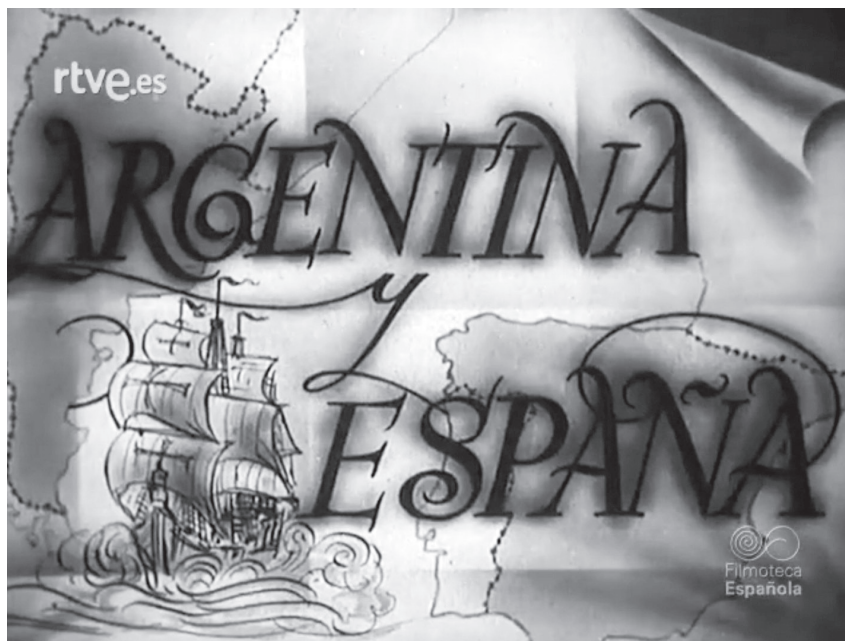
Imagen 2. Intertítulo «Argentina y España» – No-Do n.º 231B (02/08/1948).

«Argentina y España», que aparecerá en veintitrés ocasiones hasta el 25 de junio de 1973. 26