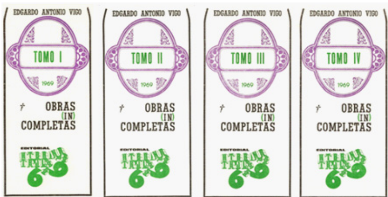
Figura 1. Edgardo A. Vigo, Obras (in) completas , 1969. Centro de Arte Experimental Vigo.

Entendemos que, sin asumirlo expresamente, Vigo ironiza sobre el mundo literario y del arte en general, y con ello, sobre un aspecto de la cultura que venía criticando desde hacía tiempo, como es la relación entre artista y espectador, y la propia entidad de la obra de arte, desvinculada de los cánones que la ubicaban en relación con las elites y alejada de la gente común.