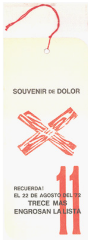
Figura 3. Edgardo A. Vigo, Señalamiento XI Souvenir del dolor, 1972. Centro de Arte Experimental Vigo.

En cuanto al titular del diario, el uso que realizó Vigo de la prensa –que ya tenía antecedentes en su propia obra, así como en la de otros artistas– se transforma, en este caso, en un elemento central que funciona como referencia contextual del tema de la obra. Al mismo tiempo, puede proponer una reflexión sobre el modo en que un medio de comunicación de masas informa la masacre de los guerrilleros.