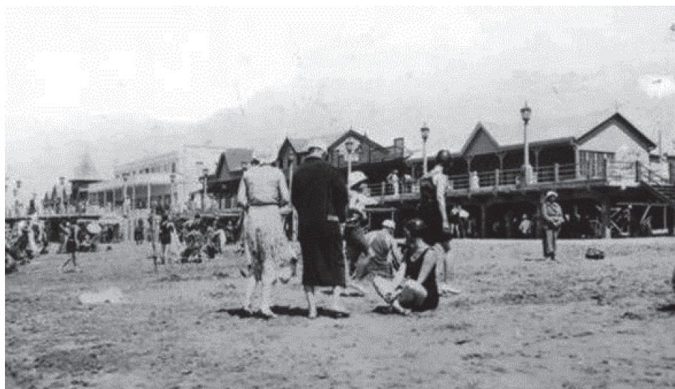
Figura 3. Uso turístico-recreativo del espacio litoral a principios del siglo XX

Al comienzo de la década de los años treinta se pavimenta la avenida Costanera, se realizan obras de desagüe y la instalación del alumbrado eléctrico en la zona costera. El historiador local, Brugueras (2004) resalta que en este momento en la costa de Miramar prevalece la construcción del chalet estilo californiano con frentes revestidos con piedra y techos de tejas a dos o cuatro aguas, que imita en menor escala las mansiones marplatenses y se anexan a las viviendas el garaje, los jardines, la decoración externa con madera y los porches. En la actualidad quedan algunos exponentes en la avenida Costanera, se trata de 12 construcciones que, en su mayoría, registran alguna modificación en su fachada.