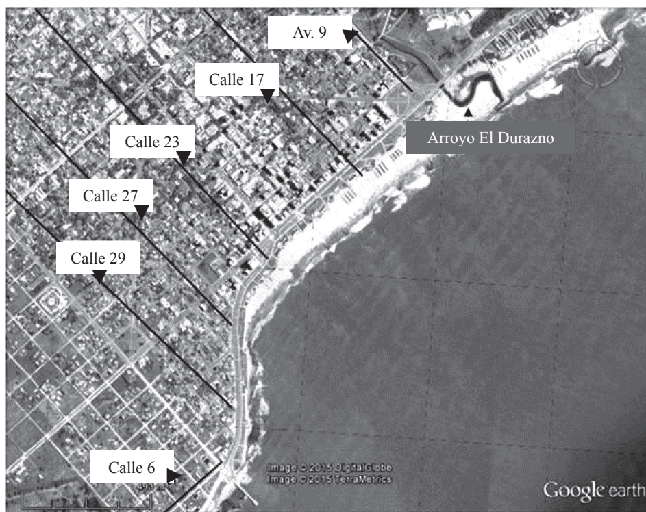
Figura 4. Playas del centro.

Uno de los principales impactos de las edificaciones en altura en la Zona Centro del área litoral es la reducción del período de heliofanía en la playa, situación que interfiere en el uso turístico y recreativo del sol y baño en el mar. La proyección de los conos de sombra originados por la presencia de edificios en altura reduce el tiempo de recreación en la playa. Asimismo, acarrea modificaciones en las masas de aire y genera corredores de viento. Por otra parte, la concentración de usos residenciales en la zona costera, sumado al aumento del parque automotor, genera congestión en el tránsito y en los espacios de estacionamiento.