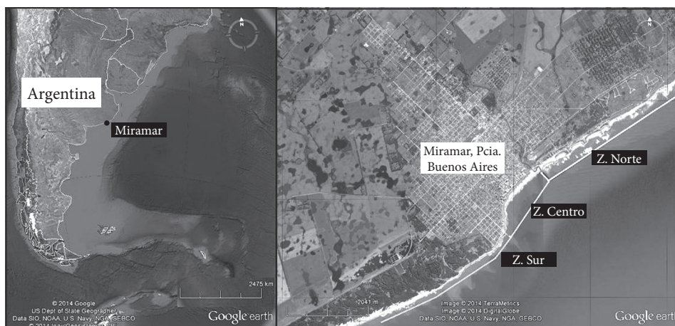
Figura 1 Área de estudio.

El principal recurso natural de Miramar es la playa sedimentaria, que favorece la afluencia del turismo en espacio litoral con marcada concentración durante el verano, siendo la actividad económica dominante. A lo largo de su evolución histórica, el espacio litoral actúa como el factor sociogeográfico que condiciona la actividad turística; por tanto, registra un proceso de continua transformación para lograr el acondicionamiento requerido por la actividad turística.