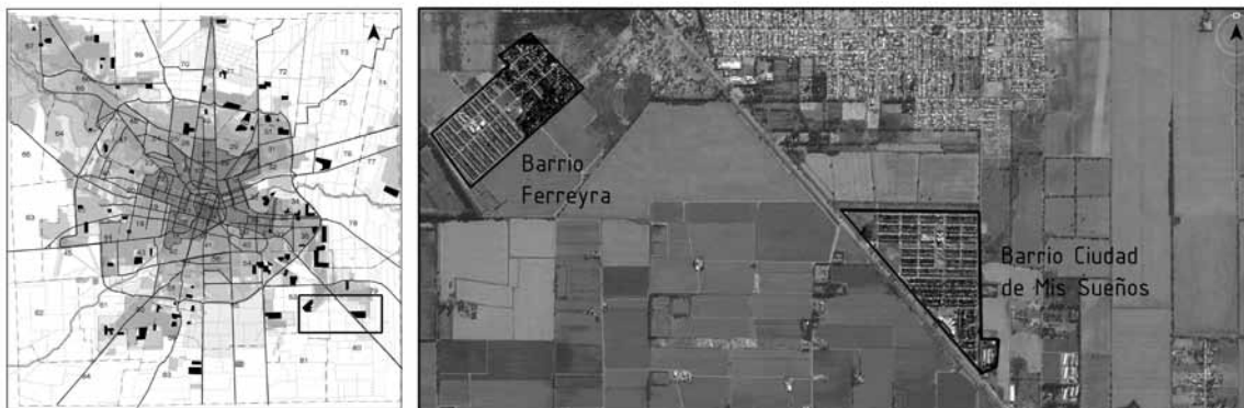
GRÁFICO 5: LOCALIZACIÓN DE LA VIVIENDA SOCIAL EN LAS FRACCIONES 53 Y 79.