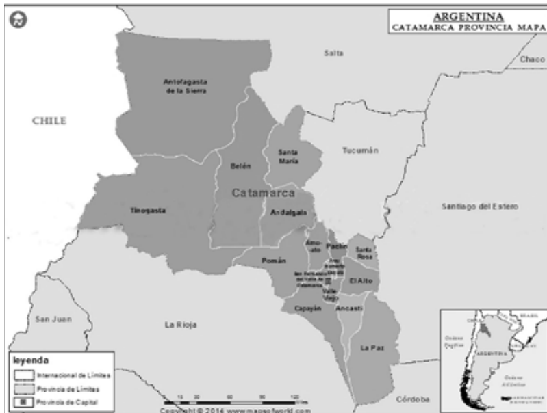
Imagen N° 1: Localización de la provincia de Catamarca en Argentina.

En este apartado nos concentraremos en analizar el comportamiento de la actividad en términos de producción provincial-nacional de minerales metalíferos y su relación con el contexto político. En nuestro país, la adhesión al modelo minero fue a partir de un conjunto de leyes creadas durante la presidencia de Carlos Menem a lo largo de sus dos períodos de gobierno 1989-1999. En este contexto la provincia de Catamarca, como muchas otras regiones del país, se configura como centro de atracción de capitales transnacionales ligados a la explotación minera a gran escala. En efecto, se considera Bajo de la Alumbrera 6 como pionera del modelo minero en Argentina por ser el mayor yacimiento del país y el primero con explotación a cielo abierto.